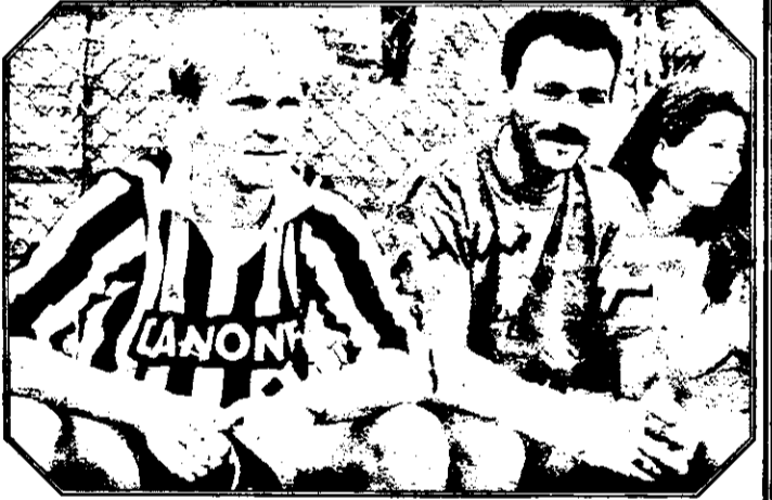
Pe banca de rezerve a echipei UTA, portarul Pap și fundașul Stupar, ambii accidentați, așteaptă reintrarea în teren.