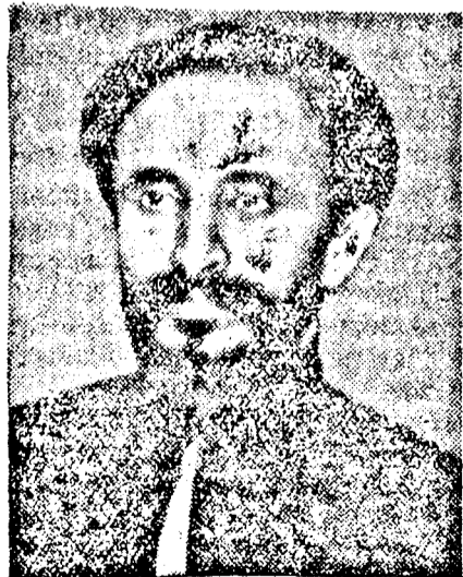
HAILE SELASSIE, abesszin császár

A Reuter-ügynökség jelentése szerint Addis Abebában felvetődött az a terv, hogy megteszik a szükséges lépéseket annak megvalósításához, hogy Mussolini olasz miniszterelnök és a Négus személyesen találkozhassanak és személyesen folytassanak tárgyalásokat az időszerű politikai kérdésekben.