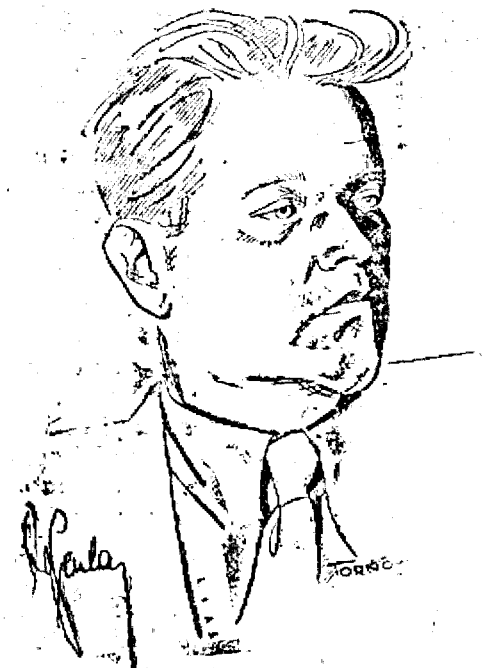
Regizorul VEIT HARLAM