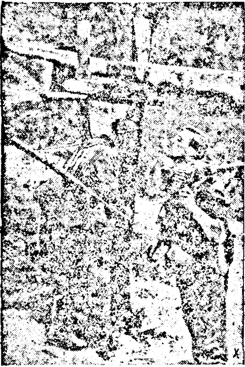
După un formidabil marș soldații germani beau cu nesaț apa rece.