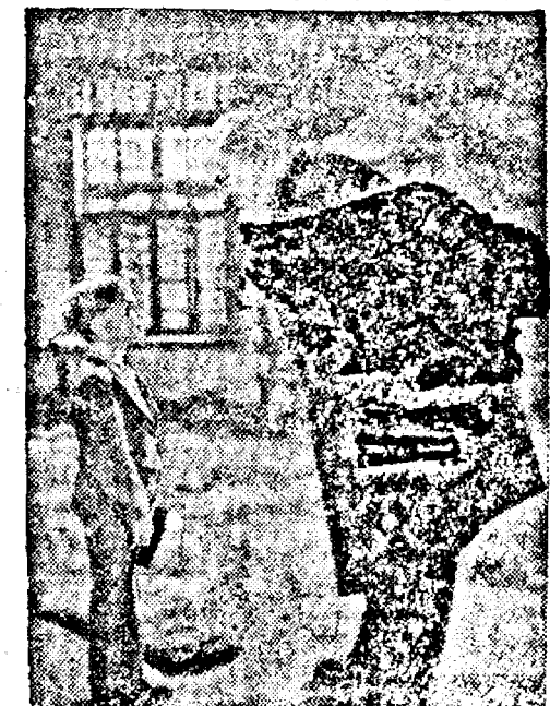
2 scenă din filmul „OHM KRUGER”.