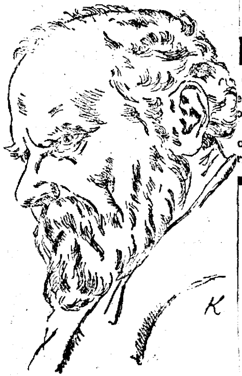
EDUARD von WINTESTEIN.

Publicul românesc a dat dovadă de un gust rafinat, admirând filmele germane „Bismarck”, „Evreul Süß”, etc. Din aceeași galerie face parte și noua film „Friederich Schiller”, sau „Triumful genului”, ceea ce va asigura succesul aceluiași săli pline și aceiași primire entuziastă a cinefililor.