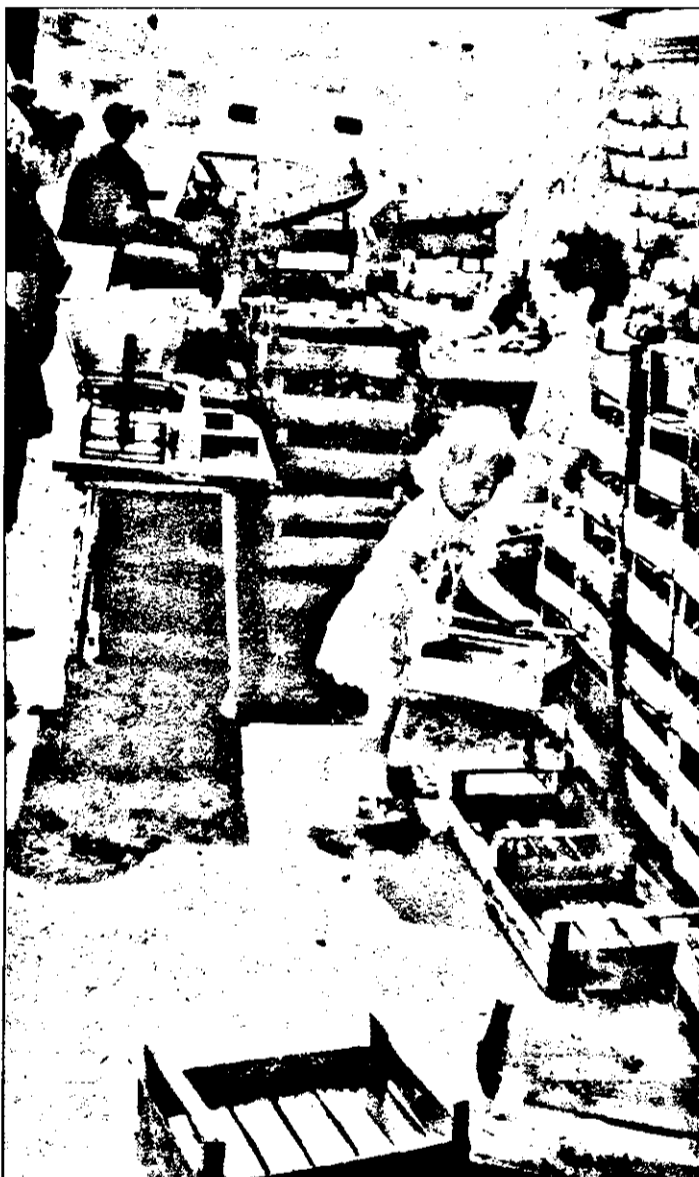
De la natură, omul e harnic. Lenea vine abia mai târziu.