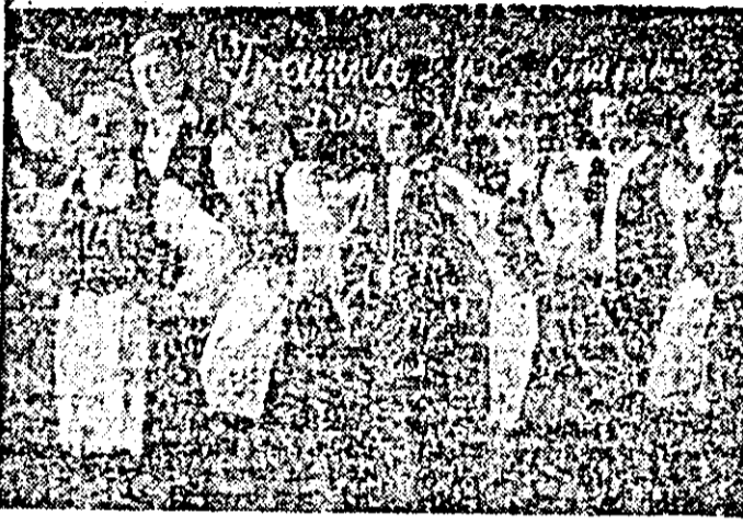
Formaţia cântărilor culturale din Pecica.