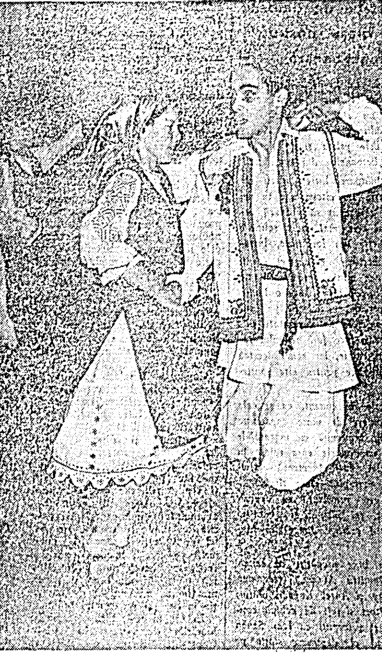
O pereche din formația de dansuri a Clubului C.F.R. în timpul execuției unui dans popular românesc la spectacolul ce a avut loc duminică trecută în sala Palatului cultural, în cadrul celui de-al VII-lea concurs artistic pe țară.