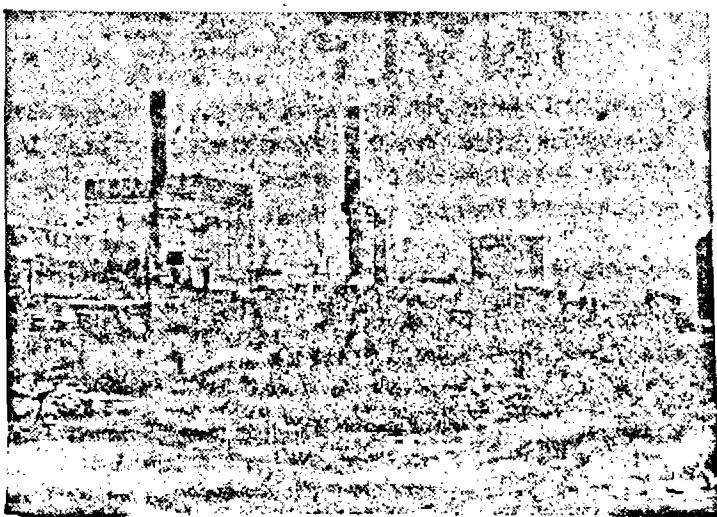
Distrugerile înfăptuite de bolșevici.

De vânzare „MAGUS“ S. A., B-dul Regele Ferdinand No. 1, lângă cofetăria „Bulevard“ spre Cazarmă.