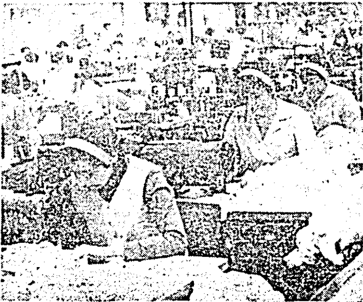
Aspect de muncă în secția confecției a întreprinderii „Tricolor roșu”.

lul 1986, a relevat că obiectivele importante care stau în fața județului nostru în cursul celui de-al doilea an al actualului cincinal impun eforturi sporite din partea tuturor oamenilor muncii arădeni, îmbunătățirea activității în toate domeniile vieții economico-sociale. Tovarășa prim-secretar a subliniat că, în lumina sarcinilor reieșite din documentele celui de-al XIII-lea Congres al partidului, a indicațiilor și orientărilor formulate de tovarășul Nicolae Ceaușescu, secretarul general al partidului, colectivelor de oameni ai muncii din industrie, agricultură și celelalte sectoare de activitate din județul Arad le revin sarcini de o deosebită importanță pentru anul 1987. De aceea, este necesar ca întreaga muncă a organelor și organizațiilor de partid, a consiliilor oamenilor muncii, să stea sub semnul unei înalte exigențe, a unei responsabilități sporite în vederea perfecționării întregii lor activități și ridicării ei la cote superioare de calitate.