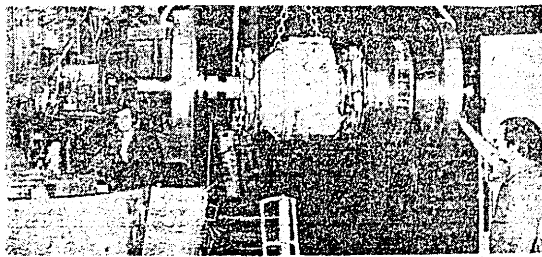
Aspect de muncă în secția boghitori a întreprinderii de vagoane.