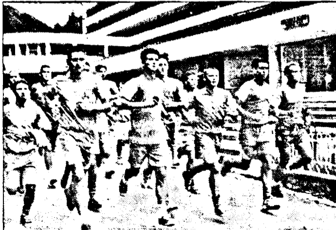
Vizibil marcați de efort, fotbaliștii arădeni luptă cu ei înșiși

Formata va disputa, la revenirea din cantonament, o suită de amicale. Adversare vor fi „U” West Petrom Arad, Telecom Arad, U.M. Timișoara, Telecom Timișoara și, în funcție de programul „Bătrânei Doamne”, UTA.