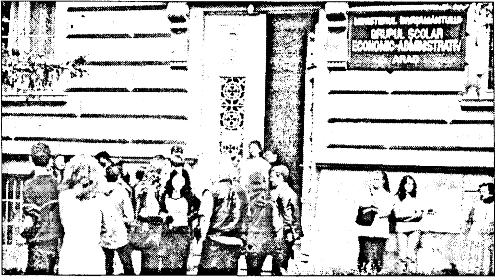
Emoții în așteptarea rezultatelor care întârzie să fie afișate