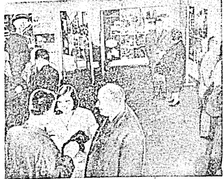
Aspect de la expoziția „România în plin progres” deschisă nu de mult la Atena.

În prima zi a discuțiilor, ministrul de externe britanic, Michael Stewart, a expus ideile guvernului său vizînd o apropiere între AELS și Piața comună prin crearea unor așa-zise „punți” de legătură între aceste două organisme. El a cerut colegilor săi prezenți la sesiune să coopereze în această direcție.