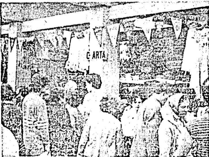
Ieri, în Piața Mihai Viteazul, s-a deschis Tîrgul de toamnă al cooperației meșteșugărești.