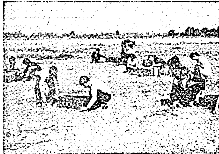
Elevii de la Liceul Industrial Ineu efectuează, în aceste zile, practica agricolă la Asociația legumicolă locală.

Cam acestea au fost cîteva lucruri pe care am ținut să vi le aducem la cunoștință, stimați tovarășii președinte și inginer șef.