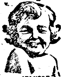
JELKEPE A TISZTASÁGNAK