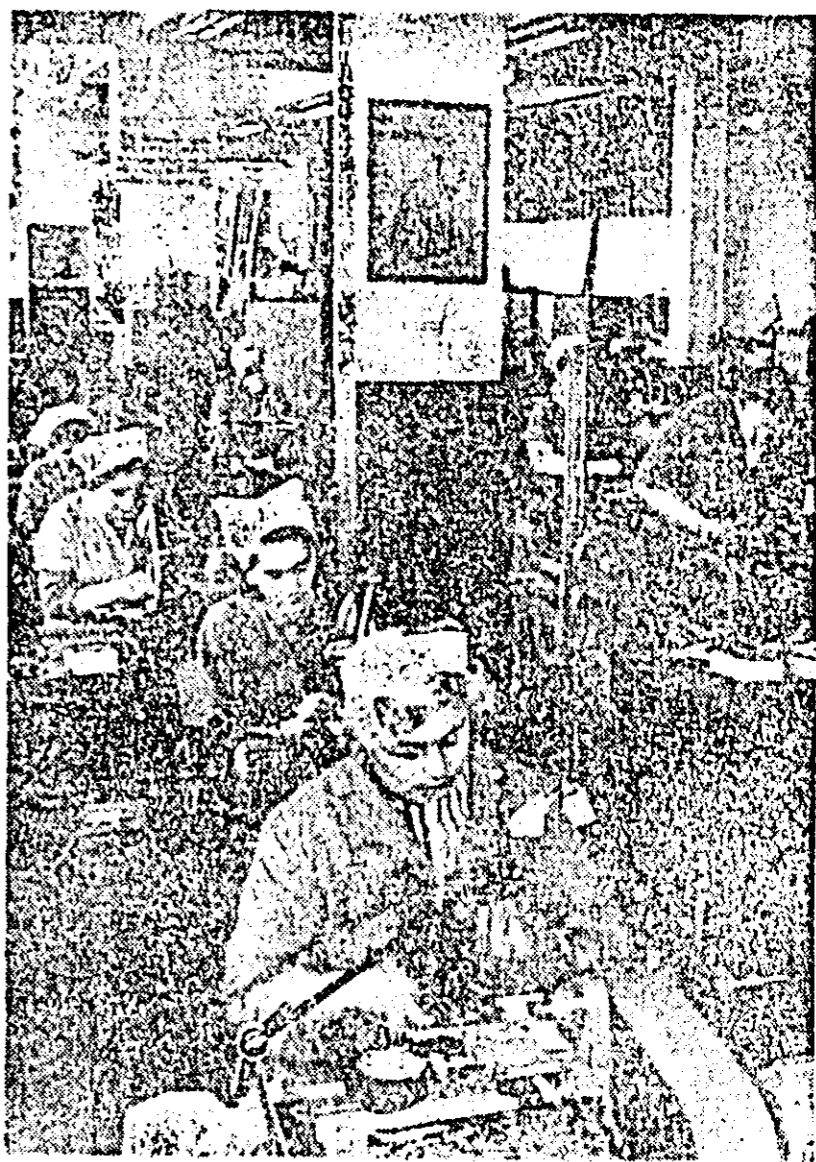
Secțiile fabricii de ceasuri „Victoria” sînt înzestrate cu mașini moderne de mare precizie și productivitate. În CLISEU: aspect din secția uzinei I. La aceste strunguri sensibile se realizează minusculele piese pentru ceasornice.

Astăzi, de la Centrala industrială de utilaj petrolier, că a fost livrată la export cea de-a 1000-a instalație românească de foraj pentru a adânci cuprinse între 1200 și 7000 metri. O pondere însemnată în volumul exporturilor o deține Uzina „1 Mai” din Ploiești, ale cărei produse sînt cunoscute în 23 de țări. De altfel, aproximativ 60 la sută din volumul producției realizată de această întreprindere este destinată exportului. De asemenea, Uzina de utilaj petrolier din Tîrgoviște și uzina mecanică din Cîmpina și-au onorat cu promptitudine contractele, expunând pe țările hotare o gamă variată de instalații pentru forajul la adâncimi mici și medii, pompe de adîncime, țije de pompare și capace de erupție. Numai în ultimii patru ani s-au trimis unor firme străine mai bine de 500 agregate de cimentare și prevenitoare de erupție de mare putere, precum și 10.000 tone armături petroliere, scule și piese de schimb. (AGERPRES)