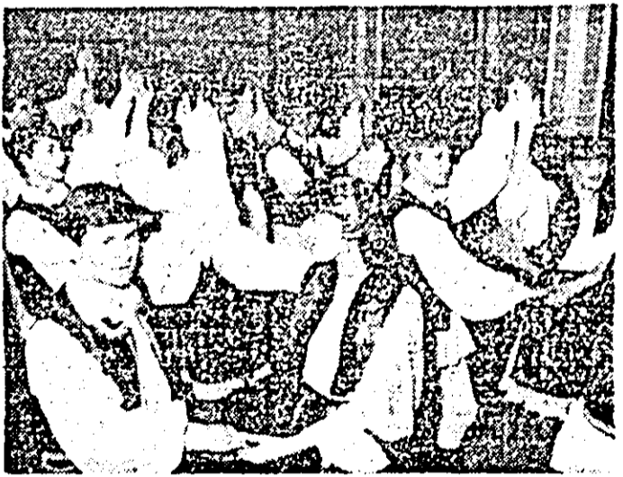
IN FOTOGRAFIE: Formația de dansuri populare a Casei municipale de cultură Arad.