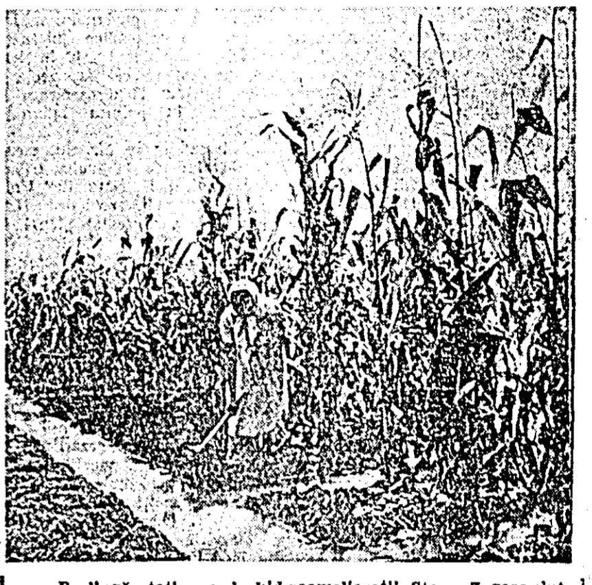
Pe lângă stațiunea de hidromeliorații Stara Zagora sînt cultivate întinse suprafețe cu porumb irigat. În câșcu: două muncitoare lucrînd la întreținerea porumbului irigat.

S-au obținut mari succese și în industria chimică. A fost pusă la punct producția de noi coloranți cu anilină, rășini carbamido-formaldehidice și alte rășini, preparate împotriva paraziților ca ozoleterea de cupru, paratlon etc. foarte eficiente pentru agricultură.