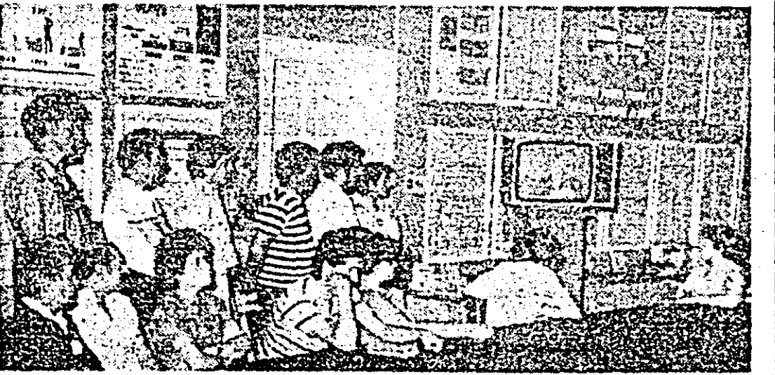
În imagine: Instantaneu de la vizionarea colectivă a magistralei cuvîntării roșii de secretarul general al partidului, tovarășul Nicolae Ceaușescu la încheierea lucrărilor Plenarei Comitetului Central și activului de partid.

lui Comunist Român și de la alegerea tovarășului Nicolae Ceaușescu în funcția de secretar general al partidului. Un asemenea moment emoționant, de înaltă satisfacție și mîndrie patriotică am întâlnit și la clubul muncitoresc al întreprinderii de vagoane din Arad, unde numeroși muncitori și specialiști se aflau grupat în fața micului ecran, ascultînd cu deosebit interes cuvîntarea secretarului general al partidului.