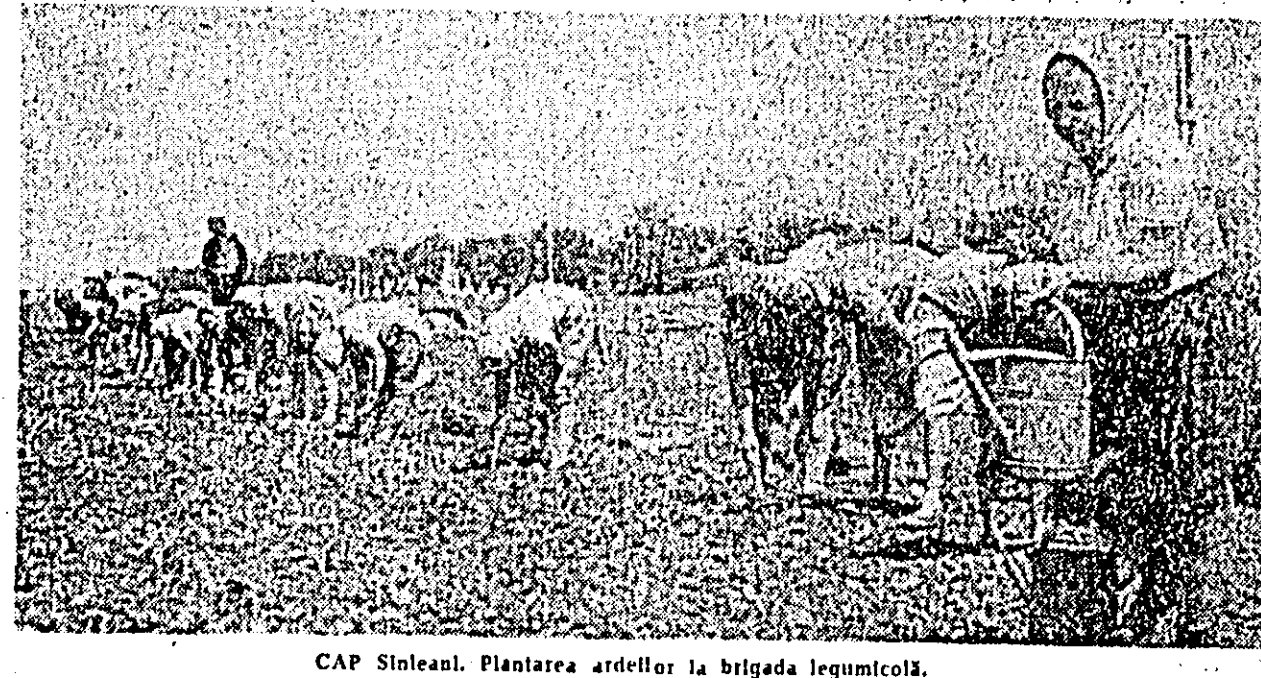
CAP Sîntean. Plantarea ardelor la brigada legumicolă.

Sebit, determinîndu-mă să scriu rândurile de față. Am găsit flori nu numai în parcul din fața birourilor de la SMA Sîntana, sau în fața atelierului, ci chiar și în imensa hală a atelierului de reparatii. Frumoase, așezate în ghivece, conferă o notă estetică aparte atelierului și asigură o ambianță plăcută în care oame. nîi lucrează cu mai multă pa-siune în vederea realizării an-gajamentelor județ. Mecanizato-rii își rezervă zilnic cîteva mi-nute, după terminarea lucrului, pentru a se ocupa de flori, u. dîndu-le și îngrijindu-le ca pe niște copii. Flori, flori... Le întîlnim la tot pasul. Sint multe pentru că ele sint simbolul bucuriei și al dragostei de viață. Și bucurie și dragoste de viață întîlnim pretutindeni. MIRCEA M. POP, Sîntana