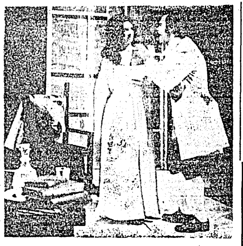
Teatrul de stat își va începe actuala stagiune cu apreciată piesă a lui Camil Petrescu, „Act venetian”. ÎN FOTOGRAFIE: o scenă din spectacol.