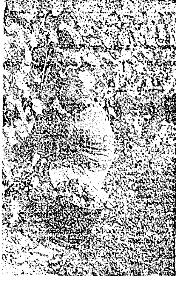
Rodul toamnei este deosebit de bogat și în podgoriile arădene. ÎN CIȘEU: la culcul strugurilor.