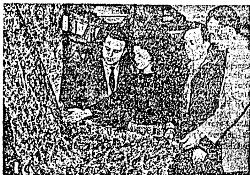
Ce frumos e acest imprimat par a spune acești finisori.

— ridicarea producției la mașinile de imprimat prin mărirea capacității de uscare a mansardelor.