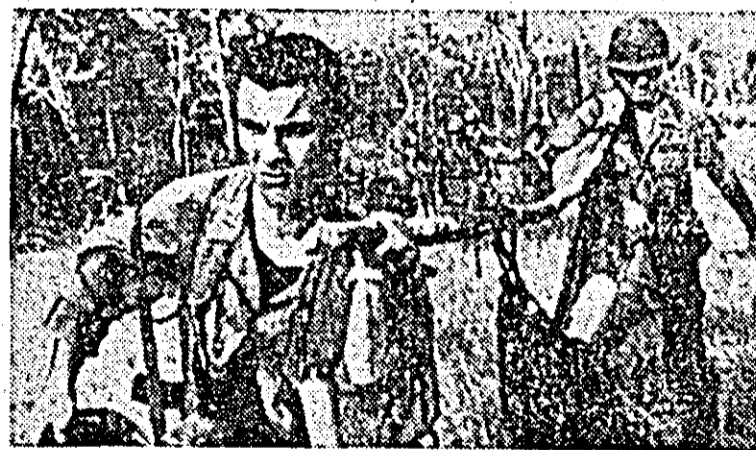
Zilnic, soldații americani cad — răniți sau ucși — în Vietnam, unde au fost trimiși să lupte pentru o cauză care nu e a lor. Imagini ca cea pe care o reproducem, în fotografia de mai sus, fac ca opinia publică din S.U.A. să-și exprime cu și mai multă tărie cererea de a se pune capăt acestui război.

Cea mai puternică manifestație împotriva războiului din Vietnam a avut loc la Washington, unde cei 600 de demonstrații care au instalat pchele în fața Casei Albe s-au adunat împreună cu mulți alți demonstrații veniți din diferite colțuri ale țării în parcul Lafayette. Unul din liderii demonstrațiilor a declarat că peste 1.200 de persoane vor participa timp de 4 zile, la acțiunile inițiate în fața Casei Albe. El a menționat că vor exercita presiuni pentru ca președintele Johnson să primească o delegație care va înmîna președintelui o petiție împotriva măsurilor de extindere a războiului în Vietnam.