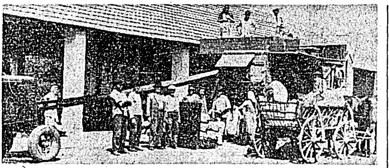
Cooperatorii din comuna Șofronea se pregătesc din timp pentru recolta viitoare. În clișeu: un aspect din timpul selecției grîului cu batoza.

În cooperativele agricole de producție din raza orașului, lucrările actuale ale campaniei agricole nu se desfășoară încă cu destulă intensitate. Astfel, mult rămase în urmă sînt adunatul și transportul paielor. La Tisa Nouă, bunăoară, din 1049 ha au fost eliberate de paie doar 165 ha. Suprafețele mici au fost eliberate și la Vladimirescu, Sînlăeni și Micălața. Din această cauză, și arăturile n-au fost executate pe raza orașului decît în proporție de 20 la sută. Dacă la Aradul Nou suprafața arată se apropie de jumătate din suprafața planificată, la Tisa Nouă, Gai, Micălața și Bujac, arăturile n-au fost executate decît în proporție de 13-17 la sută.