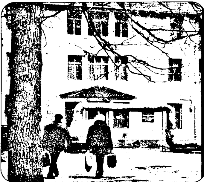
... Și totuși, la Băile Lipova (mai) vin turiști.

Într-o perioadă de tranziție tot mai dificilă, când pentru marea majoritate a populației a devenit o problemă, turismul și tratamentul balnear au rămas, poate, între ultimele din preocupările, dintre grijile de zi cu zi ale omului de rând. La această oră, întregul turism românesc este în suferință, multe stațiuni balneoclimaterice din țară fiind ocupate doar într-o mică măsură. Sunt stațiuni în țară unde turiștii, sau cei veniți la tratament, pot fi numărați pe degete. Față de acestea, situația Băilor Lipova poate fi considerată fericită, pentru că în aceste zile oamenii veniți la tratament „acoperă” 40-50 la sută din capacitatea de cazare a stațiunii. Nu e nici mult, nici bine, dar e oricum mai mult și mai bine