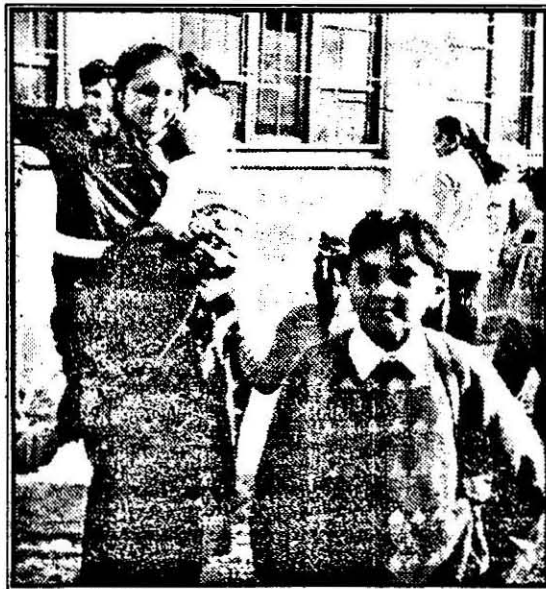
Cu toții la școală...