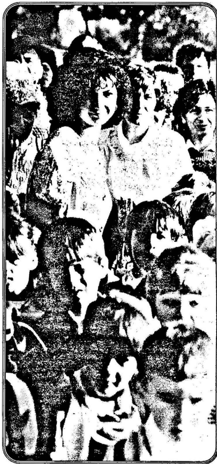
„Peisaj” cu copii și cele mai tinere învățătoare.

Cum începutul fiecărui an școlar este și debutul unei etape noi pentru elevi și pentru profesori - cu ambiții și proiecte - ne-am propus ca, prin aceste rânduri, să surprindem atmosfera primei zile a anului de învățământ 1995-1996 nu numai prin festivitățile ce s-au organizat în toate școlile arădene, ci mai ales prin gândurile și preocupările celor care, laolaltă - dascăli și elevi - formează aceste instituții.