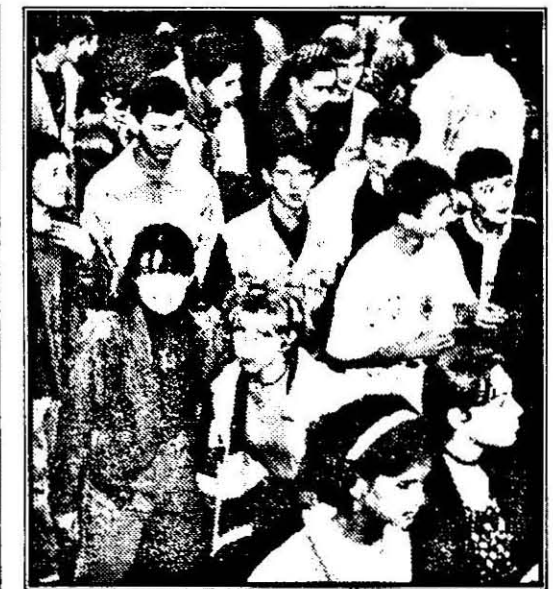
La marea chemare a școlii