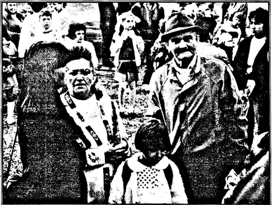
Cum bine se vede, școala a început pentru toate vârstele