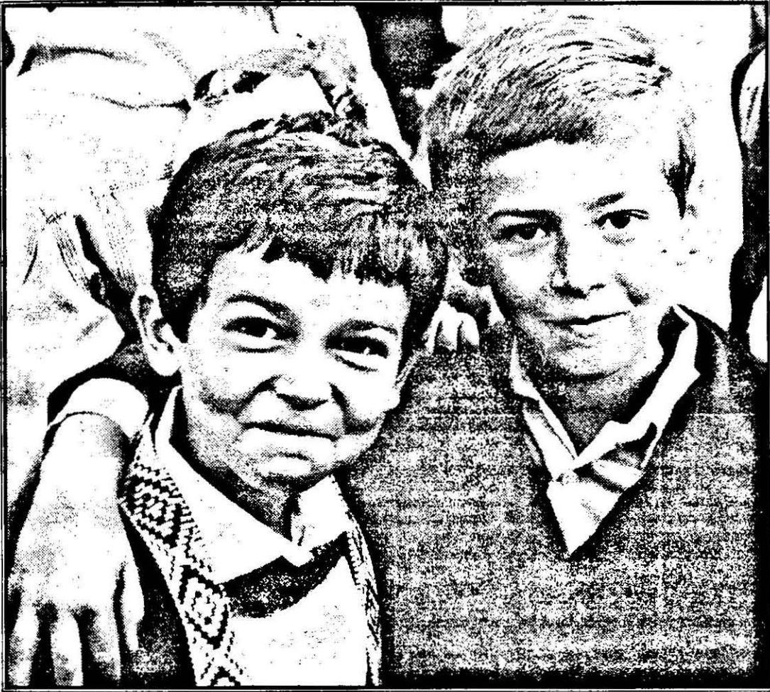
Prima zi de școală a legat și primele prietenii