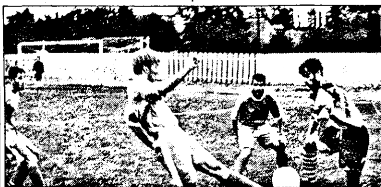
Fază din meciul disputat pe terenul FZ: „U” Arad - Șoimii Păncota (scor 0-0), din turul campionatului Diviziei D.