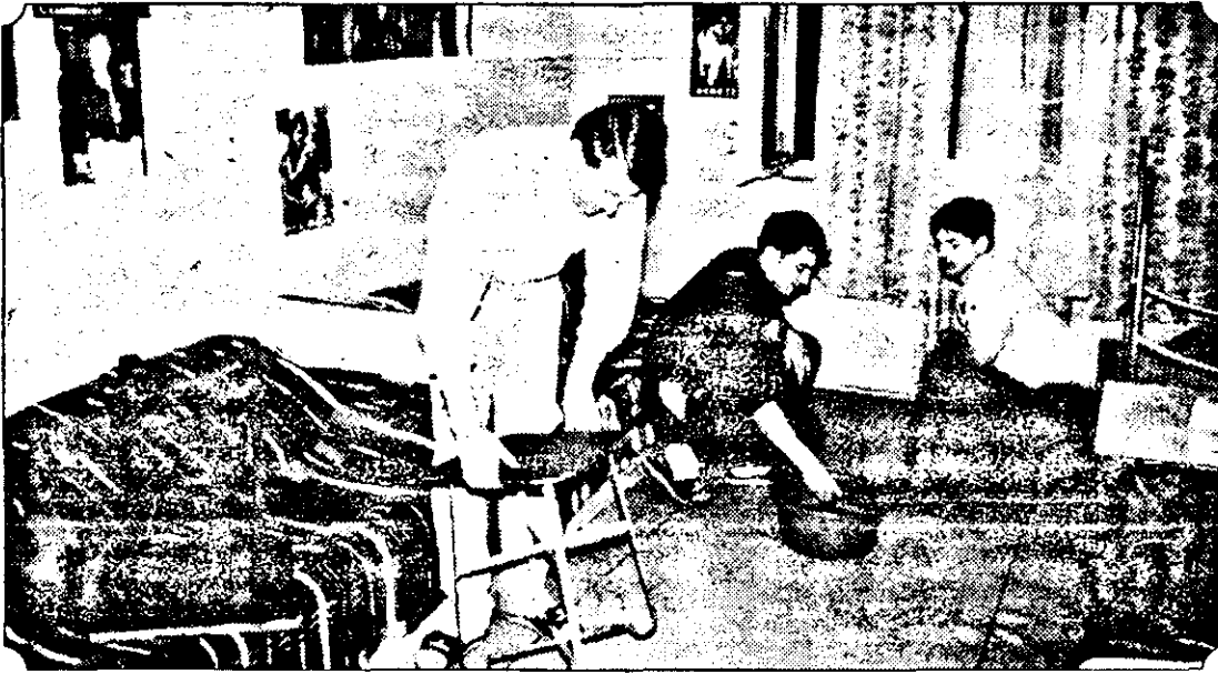
„Bagă mare, mă, că mâine vine mama!”

Postere pe pereți, casetofonul de rigoare și fetele puțin încrunțate, ne-au făcut să-i întrebăm dacă se mai și distrează: „puțin de tot, că nu prea avem timp. Totuși, mai ieșim și noi cu prietenii prin oraș, când sunt bani. În rest, am fost la nunta unui coleg, și...”