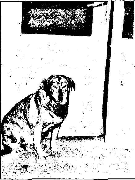
„Cerber la poarta ... tinereții”

Etaj după etaj, cameră după cameră, ne-am convins că, obligați de „împrejurări”, studenții nu prea iau în seamă spaima provocată de vreun gândac de bucătărie sau șoricel ce-și duce viața printre intelectuali, și că alimentația cu varză à la Cluj (mâncarea ce era la cină) sau ce-o mai fi, ei visează, la fel ca toată