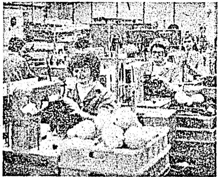
Aspect de muncă dintr-o întreprindere care și-a îndeplinit planul anual: „Arădeanca”.