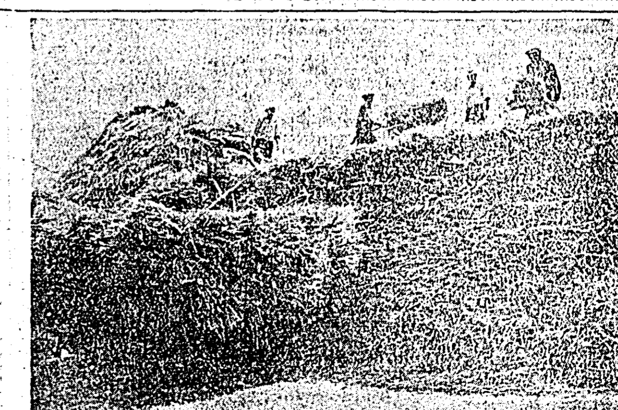
Alături, pe arle, colectivul așază ultimii snopi la sflogurile de grîu. În curînd batoza care va termina treierul orzului va începe lucrul la aceste sfloguri.