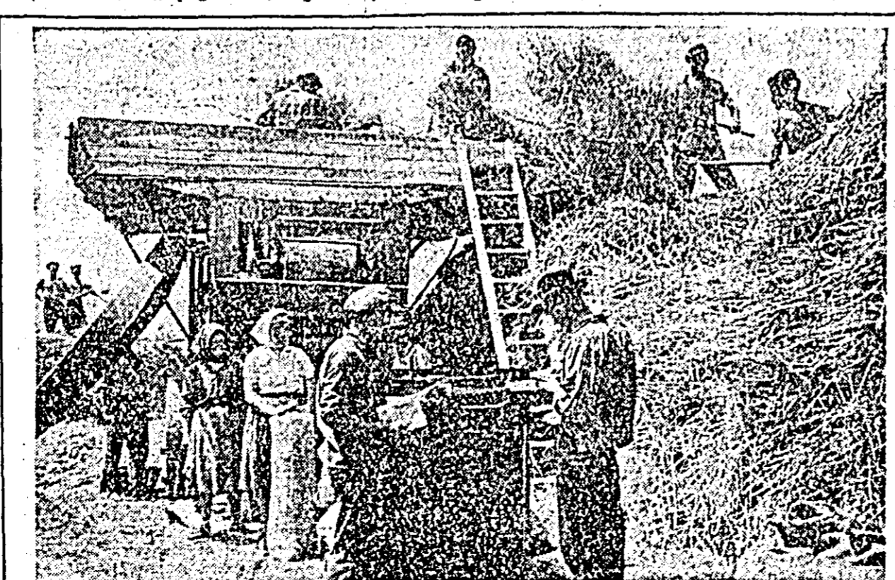
Colectivul din Aradul Nou, au terminat din timp recoltatul orzului. După ce l-au transportat la arle, ei treieră acum de zor recoltele bogate. După cit se poate vedea și din clipșu, munca la batoză se desfășoară din plin.