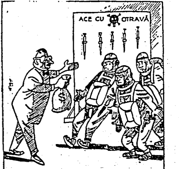
Allen Dulles — iar aceasta, băieți, e pentru ace. Desen de I. GANF dip revista „Krokodil” (Moscovia).

aventură americană care le primejdia ca lumea să fie în cel mai înspăimîntător bol. După eșecul conținerii nivelului înalt, scrie ziarul, dînește SUA a făcut promisiune solemnă că nici un avion n-ai să treacă peste granițele teritoriului U.R.S.S. alți cîi e la deține funcția. Ce s-a întimplat acum arată în ce nu-și mai exercită fus dacă admitem că el le-a dat cu adevărat vreedată. esențial ca militarii de la shington să pună capăt primejdiilor din apropierea teritoriului U.R.S.S.