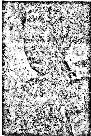
„Mulți ani dela Dumnezeu să domnești!”

În această zi de bucurie națională noi urăm Majestății Sale Mihai I, așa cum tot poporul într'un glas îi ura pe „Cămpia Dreptății” lui Ștefan cel Mare: