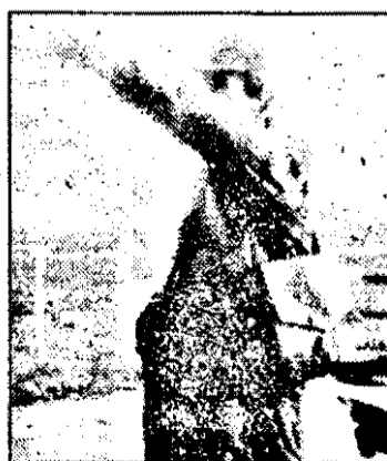
Grănicerul: „Luminile veneau dinspre Ungaria”