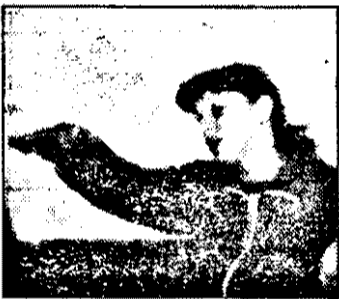
Ponta Delia: „Ceva a fost, ne-au observat, altfel...”

Sâmbătă am fost în vizită la niște prieteni din comuna Iratoș. Spre seară ne-am dus să vedem și biserica. Era ora 19,15