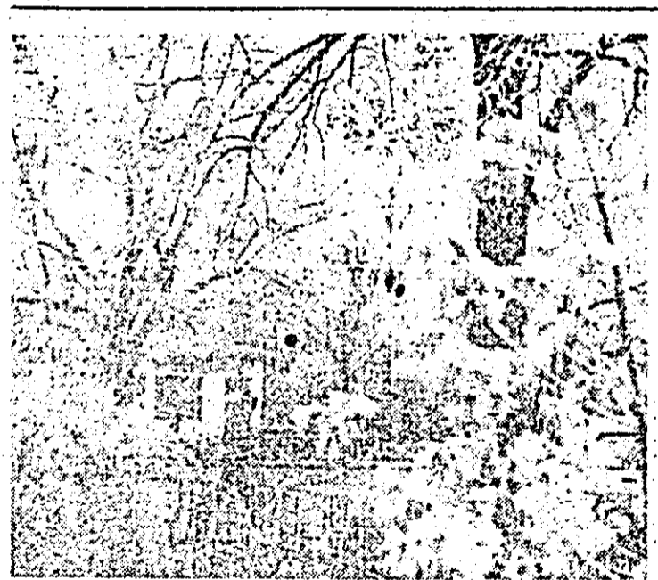
Zile de iarnă '89, la Arad.

tid și de stat cu privire la îndeplinirea politicii sanitare a partidului și statului nostru, la ridicarea nivelului de cultură sanitară a populației.