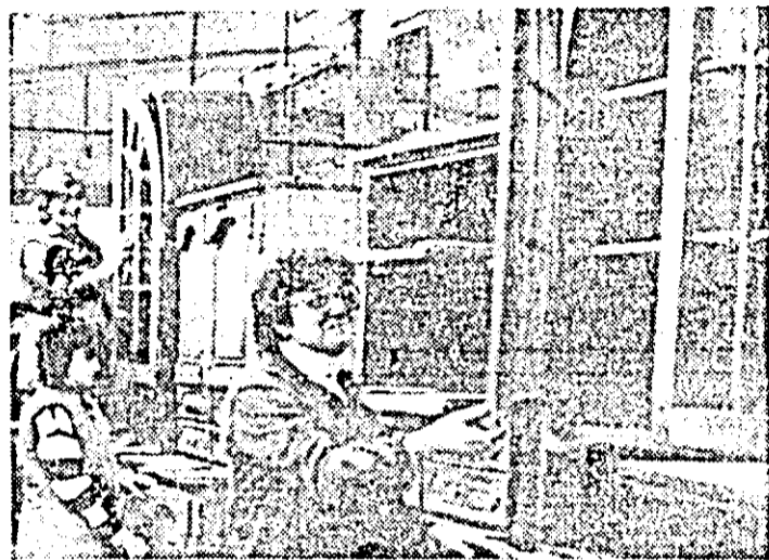
Aspecte de muncă în aceste zile, la Combinatul de prelucrare a lemnului.