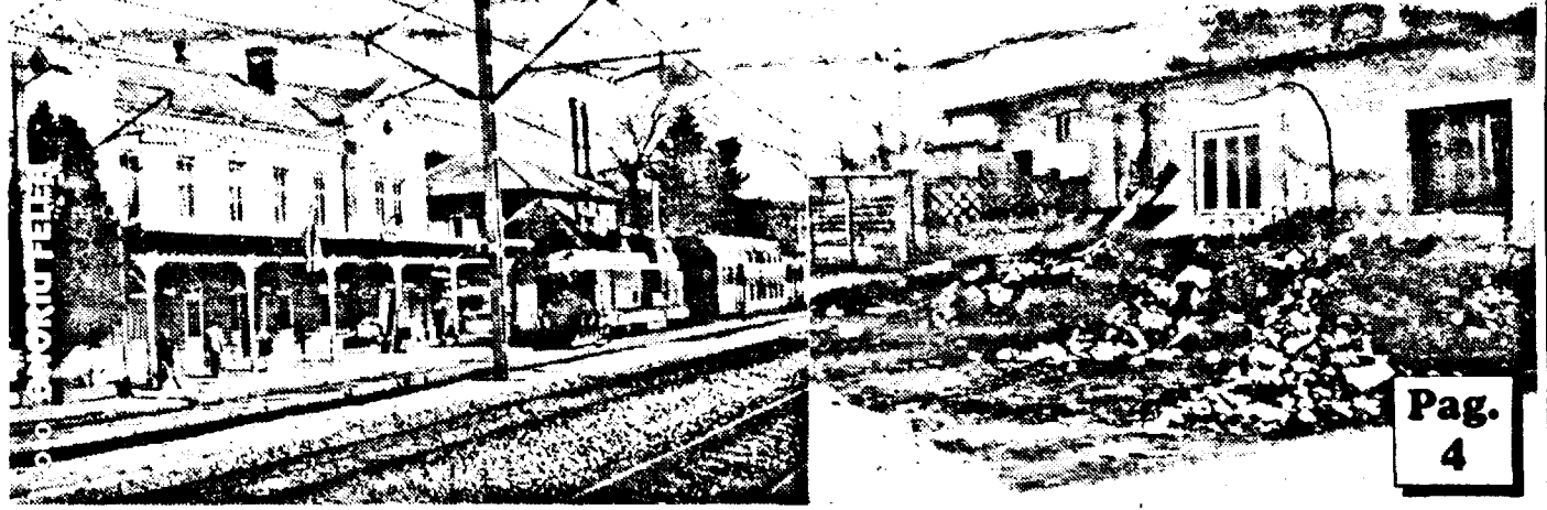
Stația CFR Lipova - fața să fie bine, că spatele nu contează