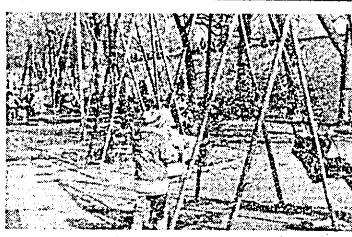
Veseli în parcul copiilor — semn că vine primăvara.

• Consiliul județean al sindicatelor Arad a declanșat în întreprinderile și instituțiile municipiului nostru seria dialogurilor artistice între formațiile artistice ale sindicatelor din secțiile și serviciile acestora. Pînă acum s-au desfășurat astfel de dialoguri în fața unui numeros public la I.V.A. (între secțiile scolare și protolipuri); I.S.A. (între secțiile turnătorie și TES), țar țer, tot la I.V.A. — între secțiile confecțiilor repere și prelucrării mecanice. Spectacolele s-au bucurat de mare succes de public.