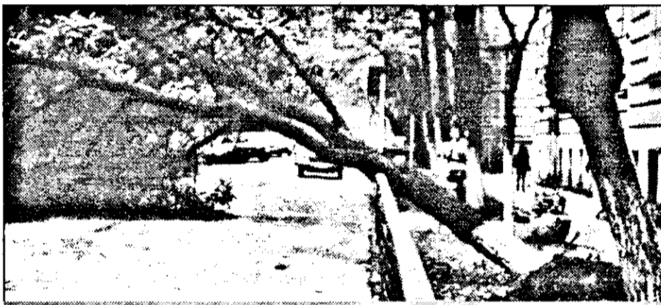
Una dintre urmările ruperii de nori din ziua de duminică, 18 august (secvență din fața Liceului „Ghiba Birta”).