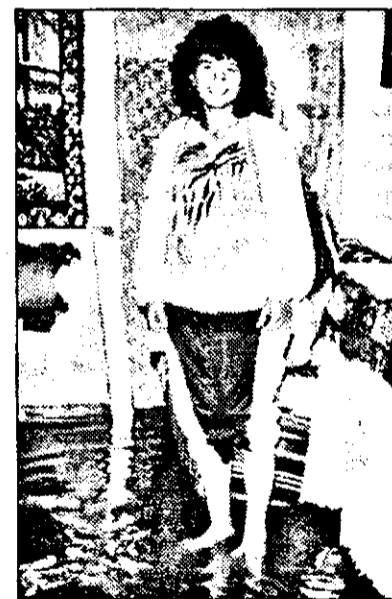
„Haz de necaz” sau un zâmbet pe adresa Primăriei...