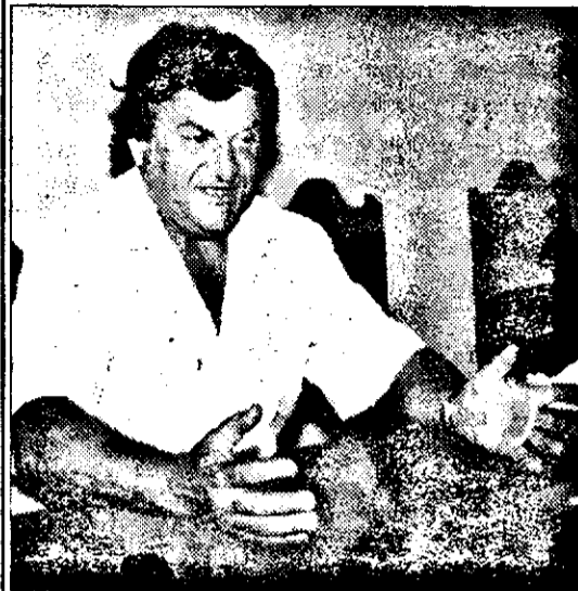
„Când am fost aleși, am zis că vom face treabă” - spune viceprimarul. Așa să fie.