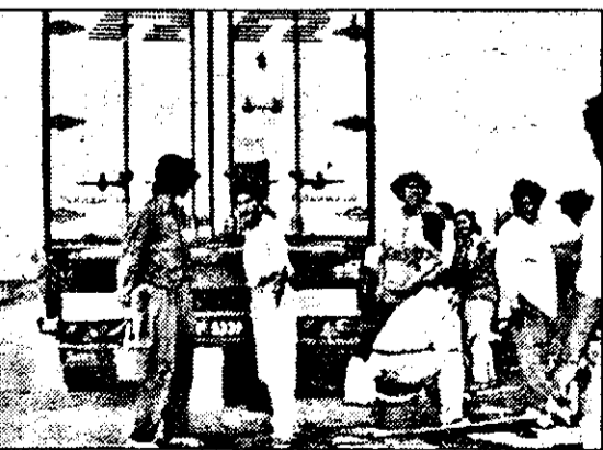
Țiganii, în așteptarea mesterilor...

De voie, de nevoie, sătui de gura țiganilor, aceștia „se supun” și după numai câteva minute au un TIR „curat murdar”.