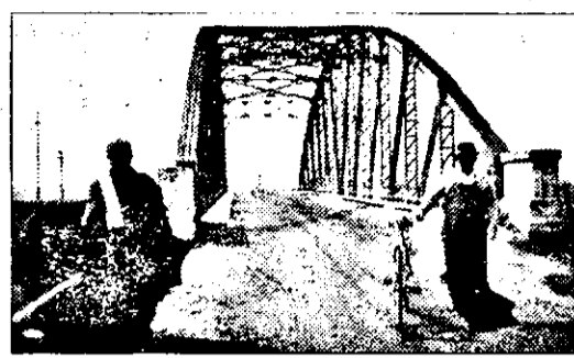
Nici podul de peste Criș nu le dă pace șiculanilor. S-a deteriorat peste măsură, iar Direcția de drumuri și poduri nu pare că-i pasă prea mult...

N-am putea să realizăm o statistică ad-hoc a numărului titlurilor de proprietate care s-au împărțit până acum în județul nostru, însă putem să ne minunăm, în adevăratul sens al cuvântului, informându-ne că la Șicula s-au distribuit doar 44 de astfel de acte. De ce? „Fiindcă nici până astăzi - ne-a spus domnul Lasc - nu s-au încheiat măsurătorile. Am mai avea nevoie de vreo doi topometriști pentru a finaliza lucrările în timp util”.