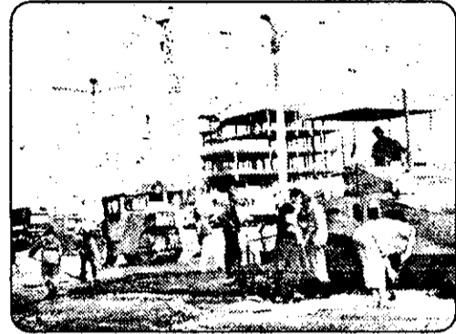
„In acest ritm... lucrările se vor finaliza la anu!”