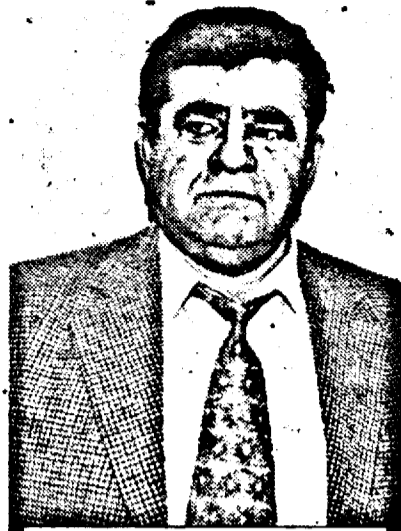
Col. Gheorghe Țica - inițiatorul acțiunii, cel care a băgat spaima în bișnițarii

ieri dimineață, într-o sedință fulger a comenzii Poliției Municipiului Arad, colonelul Gheorghe Țica, a hotărât ridicarea tuturor bișnițarilor din municipiu, aducerea lor la Poliție, confiscarea valutei, ce se constată asupra lor, a bijuteriilor și amprentarea celor care zilnic schimbă valuta pe străzile urbei noastre. „In urma unui bilanț al Ministerului de Interne, am trecut la acțiuni de asanare a municipiului Arad, de a identifica cerșetorii,