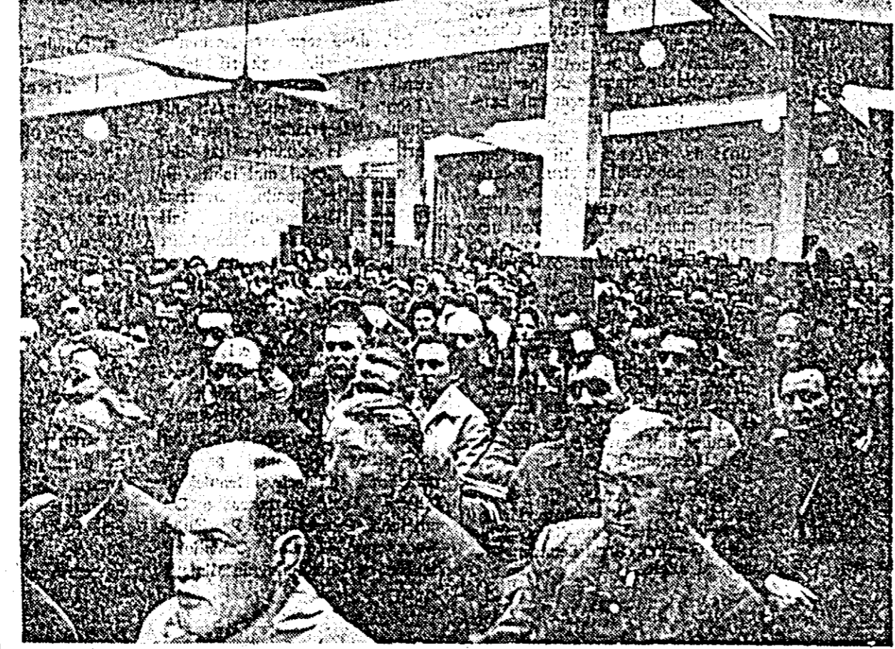
Aspect de la adunarea de doliu de la Uzinele de vagoane.

De la început și pînă la sfîrșit, adunarea a purtat amprenta durerii nemărginite care sălășuiește în inimile profesorilor, învățătorilor și elevilor în aceste clipe grele prin care trece poporul nostru. Elevii acestei școli, care învață în săli spațioase, într-o școală nouă ridicată ca atîtea altele în patria noastră în anii luminoși ai puterii populare, datorită politicii partidului de ridicare a nivelului cultural al poporului, au ascultat cu pietate și adîncă durera comunicatul care a aducea vestea a încetării din viață a marelui nostru conducător. O puternică emoție a produs în inimile tinere ale elevilor citirea scrisorilor adresate Marii Adunări Naționale de către tovarășul Gheorghe Gheorghiu-Dej. Din ochii multora, ca și din ai profesorilor și al învățătorilor, izvorăse lacrimi. Sînt lacrimi sincere, de dragoste și recunoștință pentru acela care ani îndelungați, în fruntea Comitetului Central al partidului, a condus destinele poporului român pe calea unei vieți libere și fericite, care a creat condiții minunate de învățare tineretului din țara noastră pentru a deveni cetățeni de nădejde ai patriei socialiste. Sînt în același timp lacrimi de adîncă durere pentru pierderea grea suferită de întregul nostru popor prin