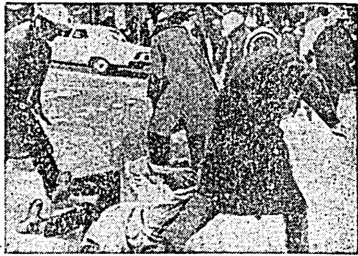
Autoritățile polițienești reprimînd, cu brutalitate acțiunile negrilor pentru respectarea legilor drepturilor civile.