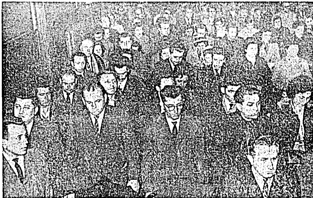
Sala Palatului cultural. Asistența păstrează un moment de reculegere.

ADUNĂRI DE DOLIU ÎN ORAȘUL ȘI RAIONUL ARAD