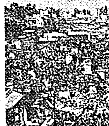
La Beirut (Liban) a avut loc un incendiu de mari proporții care a distrus aproximativ 200 de locuințe situate în districtul Keranlina.

LONDRA. Joi s-au încheiat în capitala Marii Britanii lucrările celei de-a șasea sesiuni a Consiliului internațional al cafelei. Consiliul a adoptat un sistem de ajustare automată a celor două export, în funcție de nivelul prețurilor, și a hotărît crearea unui fond internațional al cafelei.