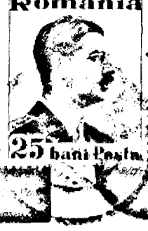
25 bani Poșta

Director: THEODOR RECULESCU Abonament: 1 an: 150.— lei, jum. de an: 75.— Autorități, mari întreprinderi 1000.— Lei. Redacția și administrația: ARAD, Strada Popa I. Rusu 3.