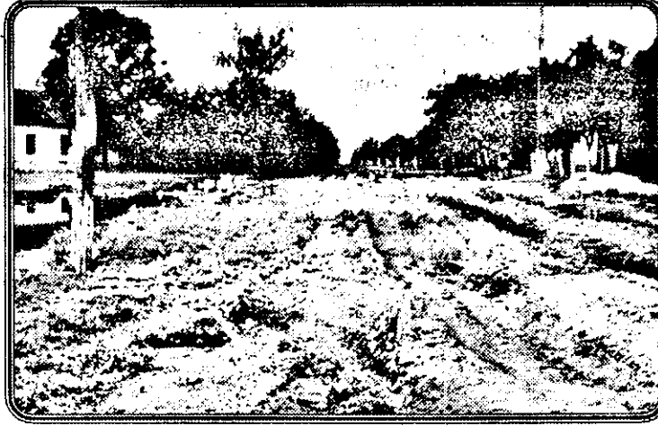
Iată motivul pentru care pacienții nu pot ajunge, cu mașinile până în fața casei tămăduitorului!