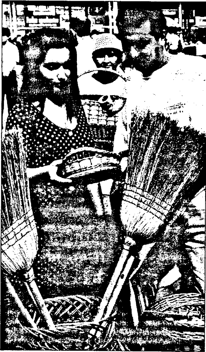
De când s-au scumpit aspiratoarele, măturile sunt la modă.