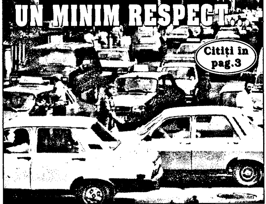
Așa arăta, ieri, Bulevardul Revoluției, înainte de intersecția cu strada Crișan, de unde a început acțiunea de asfaltare.