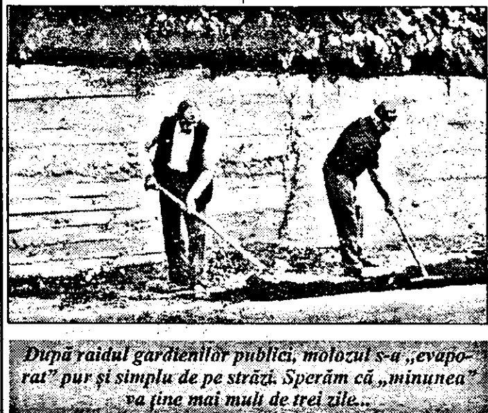
După raidul gardienilor publici, molozul s-a „evaporat” pur și simplu de pe străzi. Sperăm că „minunea” va fi mai mult de trei zile...