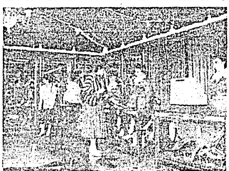
Aspect din magazinul nr. 48 — încălțăminte, recent redeschis după renovare.