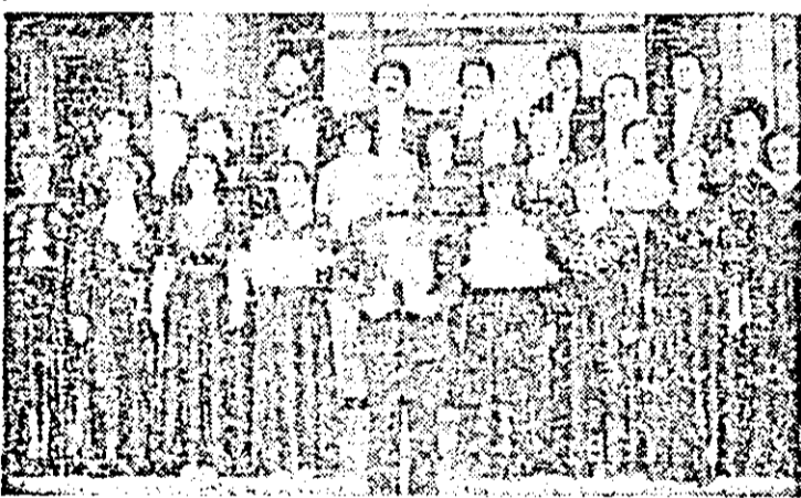
Corul „Emil Moulla” al Casei de cultură a municipiului Arad, laureat al mai multor ediții ale Festivalului național „Cîntarea României” pe scena recentului festival muzical interjudețean „Iacob Mureșianu” de la Blaj, unde a reprezentat cu cinste județul Arad.