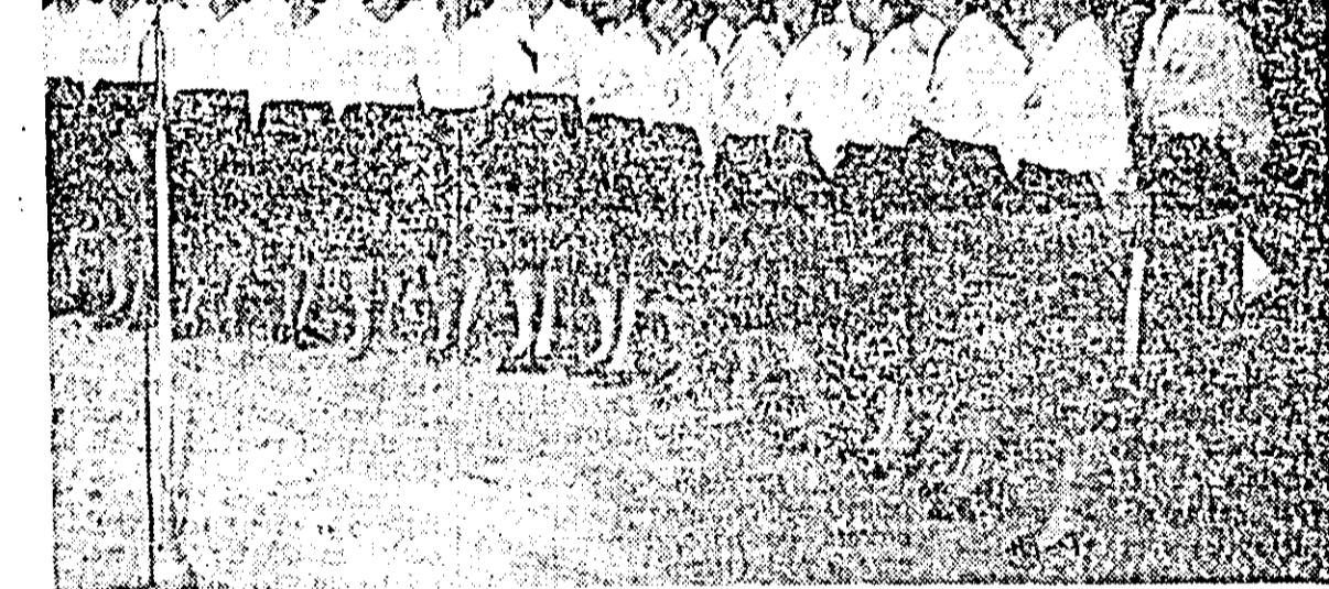
Printre cei care s-au afirmat în cadrul celui de-al IV-lea concurs regional al formațiilor de artiști amatori se numără și corul de la Pîncota, pe care îl prezentăm în clișeu de mai sus.

În continuare au fost prezentate condițiile de participare la concursul corespondenților voluntari care se va desfășura pe perioada 1 Iulie-30 decembrie.