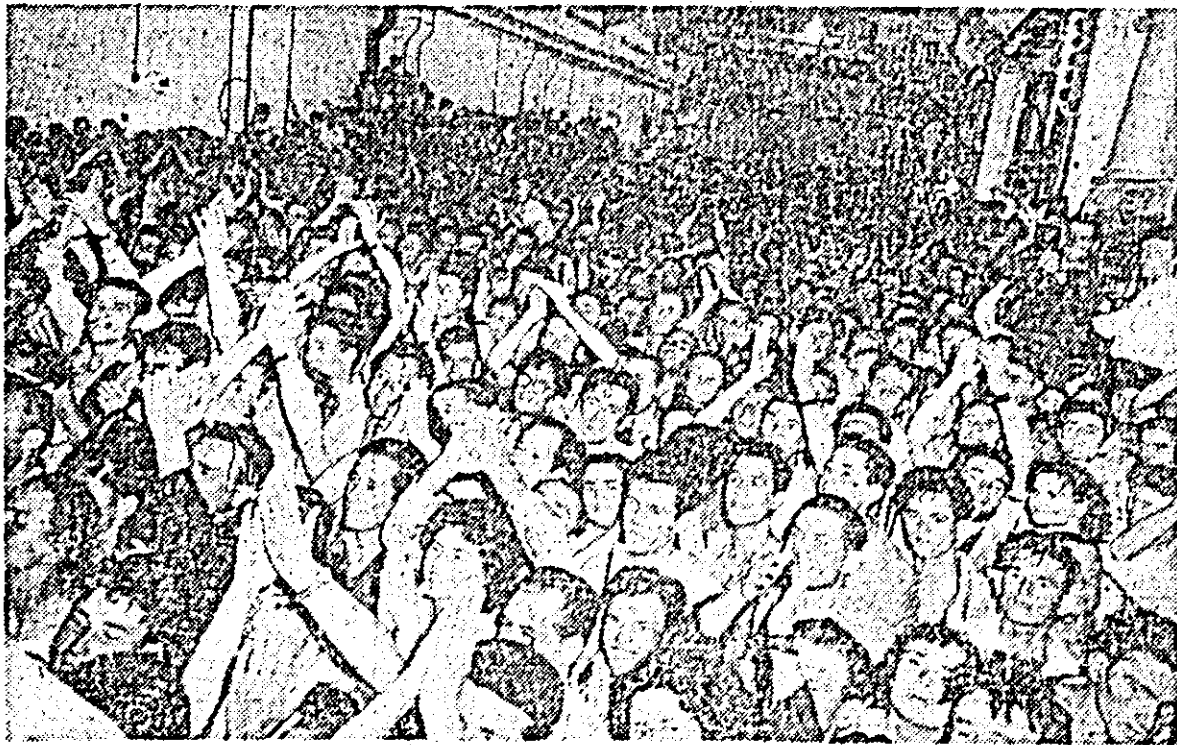
Aspect de la mitingul ce a avut loc la Combinatul de la Borzestii. Înalții oaspeți sînt primiți cu entuziaste aplauze de către colectivul de muncă al combinatului.

Sînt considerați participanți la concurs acei corespondenți voluntari care trimit redacției cel puțin 6 scrisori în fiecare etapă. La acordarea premiilor se va ține seama de importanța și actualitatea problemelor tratate, de genul și calitatea fiecărui articol.