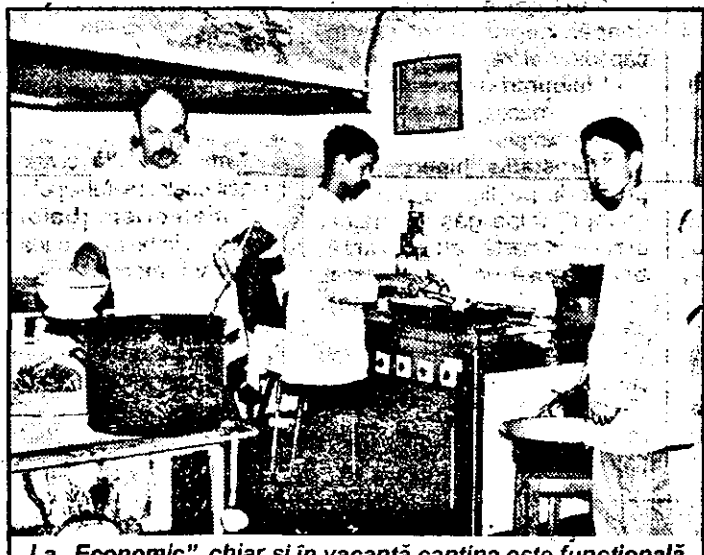
La „Economic”, chiar și în vacanță cantina este funcțională