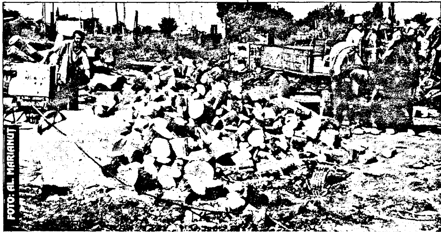
În Bujac e singurul depozit unde, pe lângă fier vechi, se mai găsesc ceva lemne și carbuni.

Tradiționala vorbă românească „fă-ți iarna car și vara sanie” te obligă să te gândești la anotimpul rece încă de la începutul toamnei. Pentru cei care locuiesc la blocuri sau au o conductă cu gaz în casă lucrurile sunt clare. Cei mai mulți, însă, n-au parte nici de una, nici de cealaltă. Și-atun-