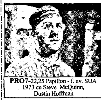
PRO7-22,25 Papillon - f. av. SUA 1973 cu Steve McQuinn, Dustin Hoffman

6,30 Viața satului 6,50 Jurnal regional 7,00 Magazin matinal, știri 10,05 Familia Faller - s. germ. 36/5: O zi norocoasă 10,30-13,00 La zece - magazin 10,50 Concurs tv 11,50 Știri, meteo 12,10 Călătorie neașteptată - s. Canada 13,12: Iubire de mamă 13,00 Știri 13,05 ABC economic: 78/2: Piața 13,10 Reclame