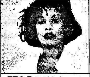
PRO 7-21,15 Bodyguard- f. acț. SUA, 1992

8,18 Prezentarea programului 8,20 Colt alb - d.a. 26/22 8,50 Religie 8,55 ABC calculatoare - magazin 9,30 Magazin distractiv duminical