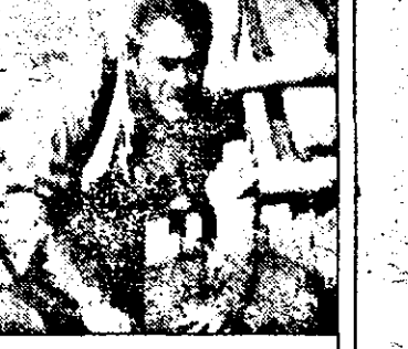
PRO7-23.30 Fără îndurare-w. SUA 1992 cu Clint Eastwood, Gene Hackman

7.00 Reflecții 8.00 Vise africane 8.30 Bucătărie franceză 8.45 Curs de lb. franceză 9.05 Jurnal canadian 9.35 Emis. pt. copii 10.15 Magazin economic 10.45 Europa, sub lupă 11.15 Ce întâmplare! - conc.tv. 11.45 Sport în Africa 12.45 Oaspeții lui Claire 13.25 Corespondență 13.45 Jurnal France 3 14.05 Pentru întreprinzători 14.30 Varietăți 15.45 Emis. distractivă 16.30 Munții-mag. pentru alpinisti 17.00 Jurnal TV5 17.15 Din carnetul unui călător 17.45 Genii - conc.tv. 18.15 Evadare în natură 18.45 Concurs tv 19.15: 7 zile în Africa 19.30 Jurnal TV5