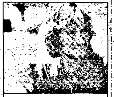
PRO7-21.15 Point Break-f. act. SUA 1991 cu Patrick Swayze, Keanu Reeves

7.05 Calătorie pe fundul oceanului - s. am. 7.55 Flirt pe stradă - show 8.20 Des. anim. 13.10 Parker Lewis, spaima școlii - s.am.: Otravă în stomac 13.30 Patru în Hawaii - s.act. am.: Valuri înalte 14.25 Cei trei din Ripide - s.act. am. 15.40 Zorro împotriva lui Maciste - f. av.IT., 1963 cu Pierre Brice 17.15 Te Deum-w. It-Sp. cu Jack Palance, Timothy Brent