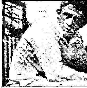
SAT 1-12,00 La est de Eden- f. SUA, 1955

9,30 Auto - Formula 1 - MP al Europei-rel. 10,30 Auto - Formula 1 - în direct Nürburgring