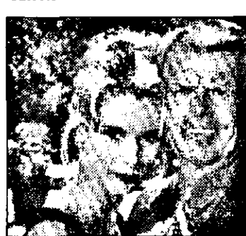
RTL-21,15 Virusul ucigaș - thriller SUA 1995, cu Nicolette Sheridan, William Devane

17,00 Baywatch - s.am.: Mich și femcia străină 18,00 Familia Partridge - s. am.: Dacă mama se căsătorește 18,30 Emisiuni regionale 19,00 Totul ori nimic - conc. tv. 20,00 Știri, sport, meteo 20,30 Roata norocului 21,15 Schwartz intervine - s. pol. Germ.: Iuviera 22,15 Hunter - s. pol. am.: Joanna a fost dezarmată 23,15 În numele dreptății - s. pol. am.: Arme nucleare furate 1,05 Om pe leagăn - f. pol. SUA cu Cliff Robertson