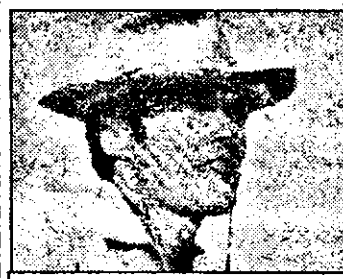
PRO 7-15 Pentru un pumn de dolari

6,30 Viața satului 6,50 Jurnal regional 7,00 Magazin matinal - știri 10,05 Familia Faller - s.Germania 36/7: Defecțiunea 10,35 La zece - mag. 10,50 Concurs tv 11,00 Lumea civilă 11,50 Concurs tv 12,00 Știri, meteo 12,10 Happy Hollyday - s.Germania 13/5: Cain și Abel 13,00 Știri, meteo 16,05 Prezentarea programului 16,10 Meditații - Literatură 16,50 Desene animate 17,00 Știri