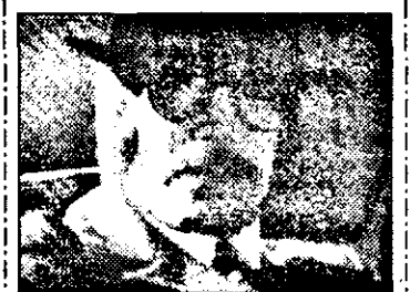
PRO7-1.05 Măcel în San Francisco - f.act. SUA, 1982 cu Chuck Norris, Robert Earl James

6.28 Prezentarea programului 6.30 Viața satului 6.50 Jurnal regional 7.00 Magazin matinal. Din cuprins: știri 8.50 Reuters - jurnal economic 10.00 La ora 10 - magazin 10.05 Familia Faller - s. Germ. 36/3 10.35 La ora 10 - magazin 10.50 Concurs tv 11.00 Corp sănătos 11.30 Concurs tv 11.45 Colul gospodinei 11.50 Știri, meteo 12.00 Dallas - s.am.: Inteneric, la capătul tunelului 13.00 Știri, meteo 16.00 Prezentarea programului 16.05 Lupte libere C.M. 16.30 Europa - magazin 17.00 Știri, meteo 17.10 Afaceri - jurnal economic 17.25 Topmodel - s. Brazilia 18.00 Emisiunea vârstnicilor 18.30 Informații utile