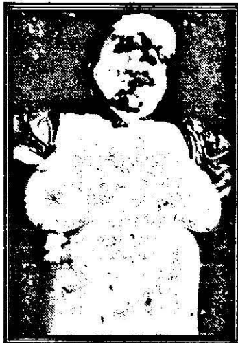
Aspecte din genocidul asupra sârbilor