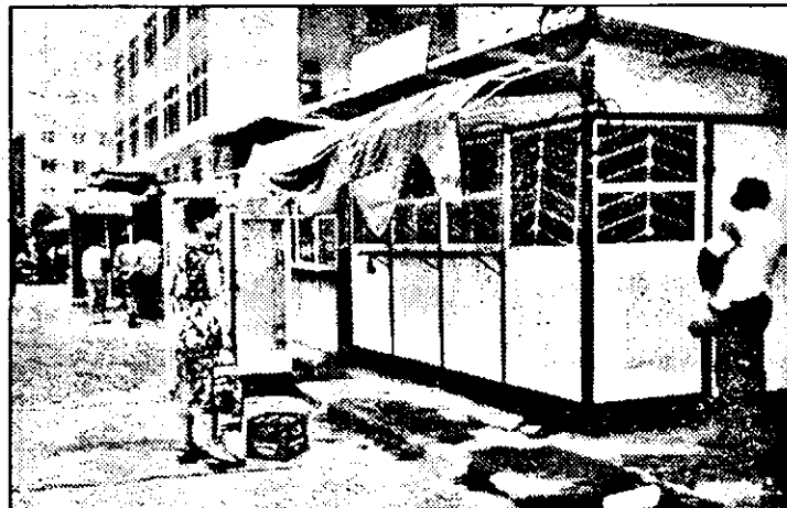
Mai mult sau mai puțin autorizate, sute de chioșcuri și tonete construite și amplasate la întâmplare, urătesc aspectul urbanistic al Aradului, sub privirile neputincioase și indifferente ale Primăriei.

punem consilierilor locali care și-au făcut un mod de a fi doar din emiterea de hotărâri, nu și din urmărirea aplicării lor. Cât despre soluțiile propuse pentru remedierea acestei situații, adică elaborarea de planuri de detaliu pentru unele piețe arădene care, la punerea lor în practică, ar duce implicit la desființarea dughenelor, ne punem problema dacă nu este vorba mai degrabă de un paleativ, un simulacru de rezolvare, decât o soluție viabilă?