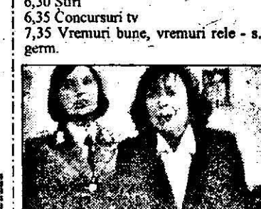
SAT 1-21,15Acuz - f. tv Germ. 1993 p.2

6,30 Taff - mag. rel. 6,50 Sub un acoperiș - s.am.