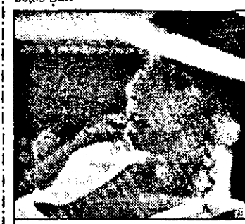
PRO7-0,15 Emmanuelle 5 f. erotic FR cu Sylvie Kristel, Marcela Walerstein

6,55 Taff - mag. 7,10 Sub un acoperis-sam. rel. 7,35 Desene animate 9,15 Waltonii-s. am. 10,10 Alf-sam. 10,45 Greace - rel. 11,15 Safari-fav.SUA-rel. 13,00 Hart to Hart - s. av. SUA: Monede false 14,00 Remington Steele - s. pol. am.: Marea lovitură 15,00 Arabella Kiesbauer show 16,05 Micuța noastră fermă-s.am.: Zăpadă de primăvară 17,05 Desene animate 19,00 Sub un acoperis-s.am.: Steve, câmpionul 19,25 Alf-s.distr.SUA 20,00 Grace-s.SUA 20,30 Taff - mag. zilei 20,55 Știri