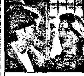
SAT1-21,15 Comisarul Rex-s. Germ. 1995: Adu-mi capul lui Beethoven!

7,00 Casa Deschenes - s. 7,30 Magazin matinal 9,05 Jurnal canadian 9,35 Emisiune pentru copii 10,15 Magellan - magazin 10,50 Utl de știut 11,15 Al 5-lea post-mag. 11,45 Corespondent special 13,15 Modă 13,45 Jurnal F3 14,05 Luminile Parisului - rel. 14,30 Serie Noire-Fpol. 16,30 Casa Deschenes - s.rel. 17,00 Jurnal TV 5 17,15 Bucătărie franceză 17,30 Emisiune pentru copii 18,15 Fa, Si, La - a cânta 18,45 Concursuri TV - Campionul 19,15 Imagini din America 19,30 Jurnal TV 20,00 Luminile Parisului 20,35 Jurnal elvețian