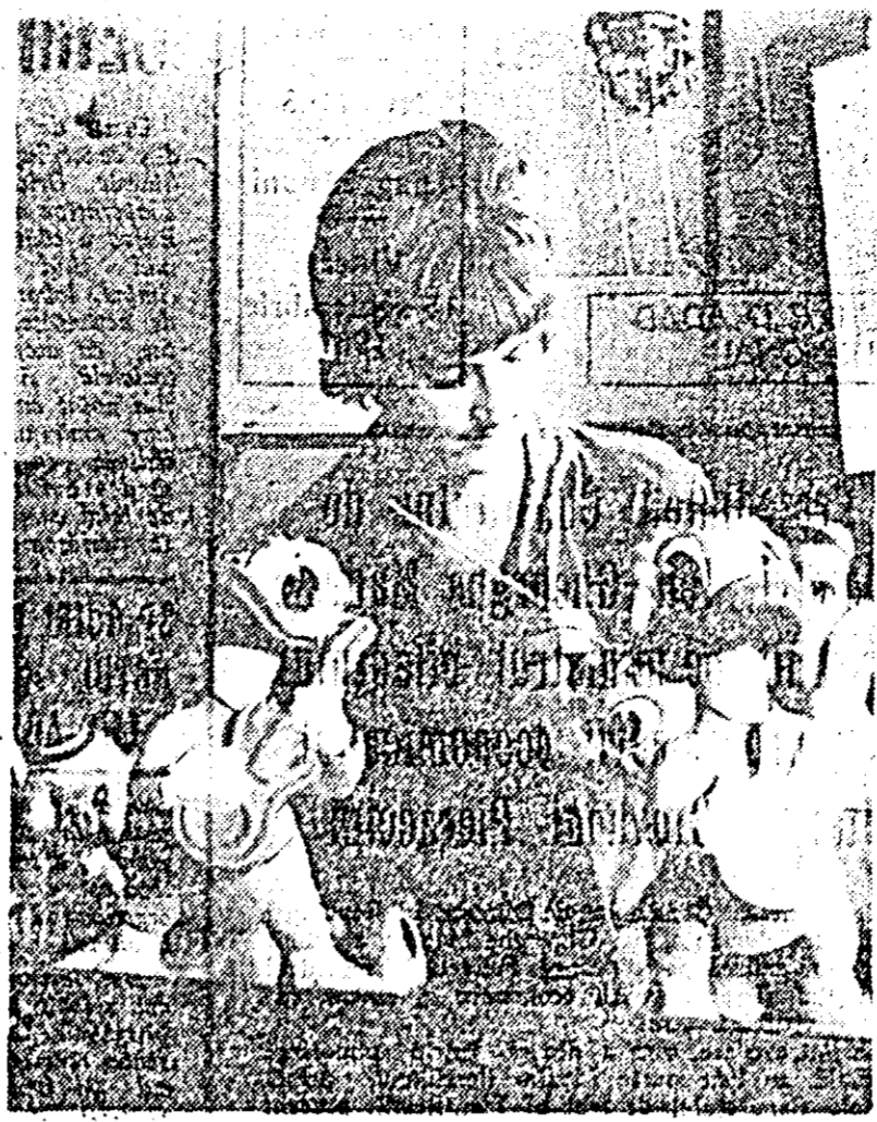
Zeci de sortimente de păpuși și figurine din materiale plastice, frumoase și în stare să satisfacă cel mai „pretentios” gusturi ale copiilor, se realizează zilnic la întreprinderea „Ardeanca”. ÎN CLIȘEUL nostru — o secvență din procesul de creare a noilor figurine.

— Aveți pline? — Nu avem. — Nicii n-ai avut? — Ba da, dar s-a terminat. Începi că „Alimentara” din colt dar aici e așa de mare inghesuiala încît e imposibil să răzbată la pîlne. Te duci de aici la unitatea