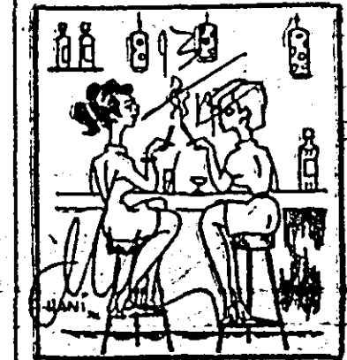
— Ești de mult aici? — De vreo patru ore... Și mă simt așa de obosită!

În timp ce marea majoritate a oamenilor muncesc în întreprinderi, pe șantiere sau pe ogoare, unii tineri, necădurați într-o activitate utilă, își pierd vremea în barul de la „Astoria”.