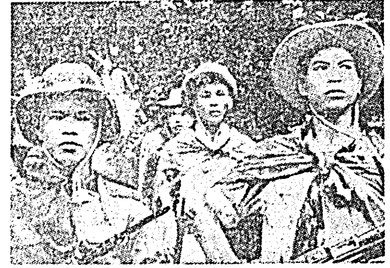
În primele patru luni ale acestui an, armata de eliberare națională sud-vietnameză a scos din luptă circa 20.000 de soldați din trupele guvernamentale și americane. ÎN FOTO: soldați ai armatei de eliberare națională.