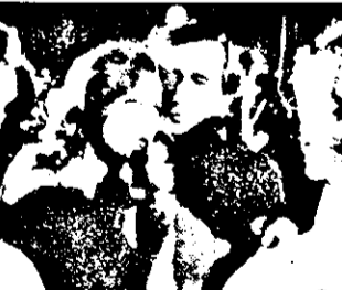
21.15 Singromul China - thriller politic SUA

14.55 Prezentarea programului, meteo 15.00 Noutăți 15.25 Acelé minunate animale - doc. 15.45 Magazin ecologic 16.15 Reportaj 17.00 Prezentarea programului meteo 17.05 Anul familiilor 17.45 Copaci simbol 17.55 Auto 2 - mag.automobilistic 18.25 Desene animate 18.55 Noul Lassie - s.am. 19.21 Meteo 19.25 Emisiunea poliției 19.40 Expoziția de artă plastică 20.01 Familia SRL s.distr.maghiar 20.37 Călătorie neașteptată - s.Canda XIII/4 21.30 Hotel Paradis - s.german XIII/1 23.05 Muzica