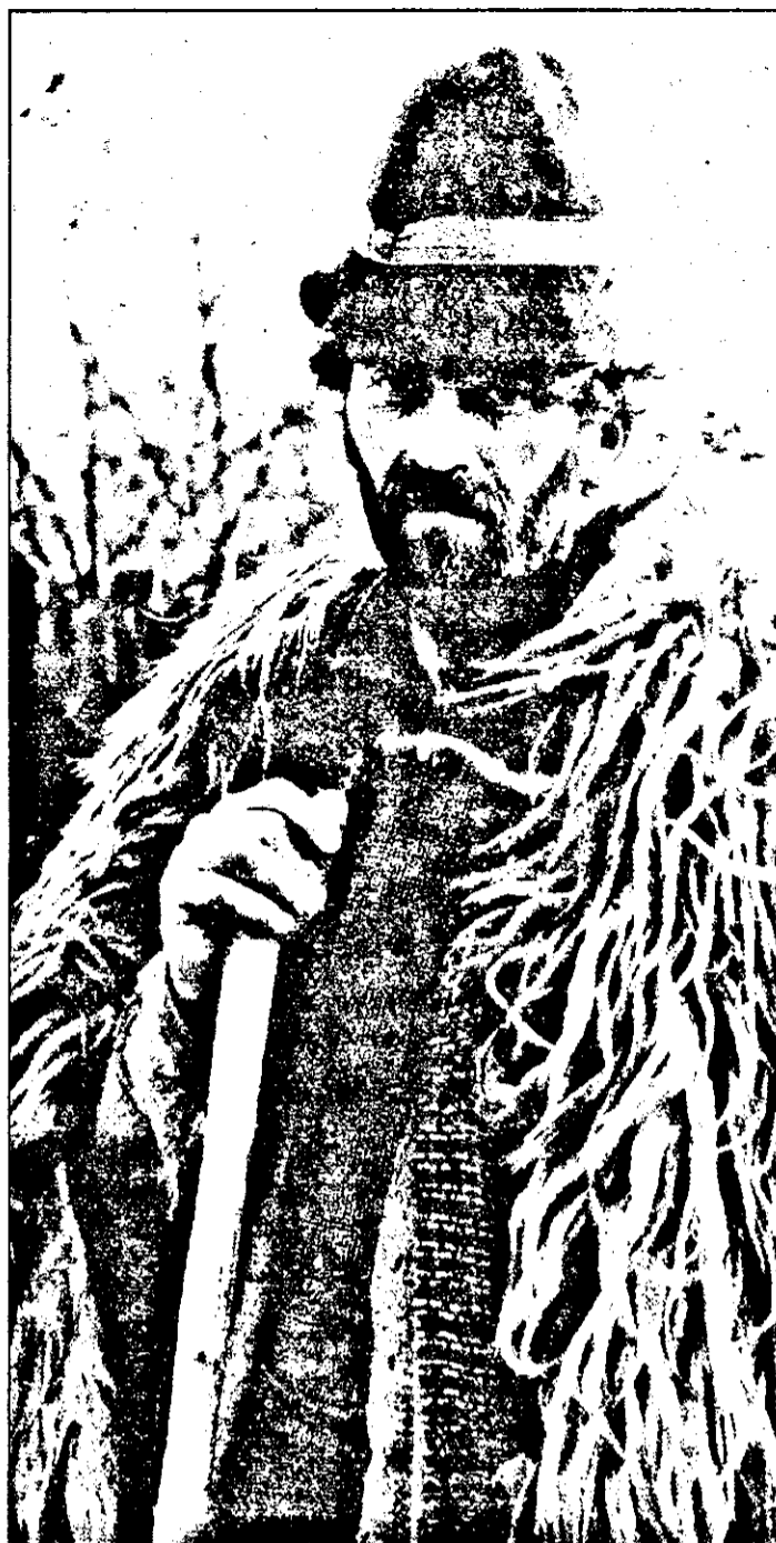
- Da' pentru o oaie, cât o fi impozitu'?