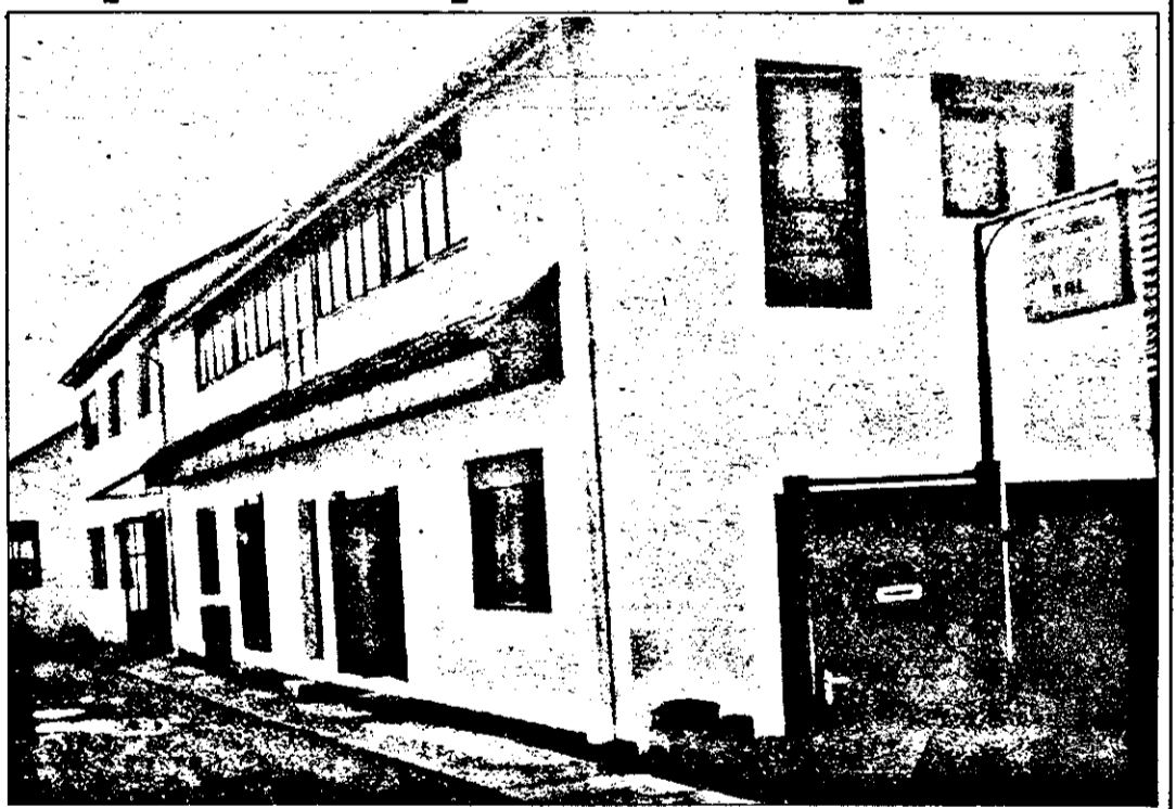
Așa arată clădirea și incinta societății comerciale Concordia SRL, într-o zi obișnuită de lucru: totul este curat, întreținut ca la... patron.

Red.: Dacă ați avea puterea de a decide, ce ați face pentru sprijinirea întreprinzătorilor particulari?