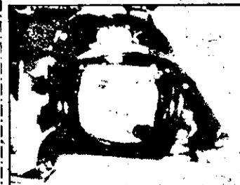
23.15 Firefox - film acțiune SUA 1981

7.30 Stiri NBC 8.30 Hello, Austria! magazin 9.00 Stiri ITN 9.30 Europa - magazin informativ 10.00 Super shop 12.00 Muzică în direct 14.00 Azi - mag.informativ 15.00 Sportmagazin: motociclism, golf, volei pe plajă, box 19.00 Azi - mag. informativ 20.00 Jurnal ITN 20.30 Magazin ecologic