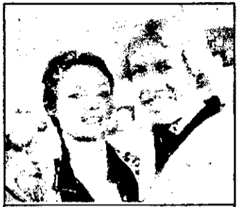
0.25 Duel de karate - film acțiune SUA, 1979

- în direct 18.00 5x5 - concurs tv 19.00 Totul ori nimic - concurs tv 20.00 Stiri, sport 20.30 Roata norocului 21.15 Zeii au căzut în cap - comedie Africa de Sud, 1982 cu Ni Xau, Sandra Pniskoo 23.20 Fotbal magazin 0.05 Reportaj despre precocitate - film erotic Germania 1.40 Star 80 - film SUA, 1983 - cu Eric Roberts, Muriel Hemingway