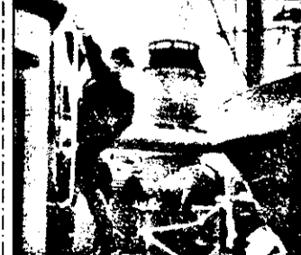
RTL : 21,15 Minge de eci - serial Germania 1993

8,15 Lumea afacerilor 8,30 Buletin financiar 8,45 Afaceri la zi 10,00 Comerț tv 13,00 Știri din finanțe 13,30 Reportaje din piața internațională 14,00 Azi - reportaje - în direct 14,30 Piața europeană 15,00 Roata banilor, reportaj la zi de pe Wall Street 19,00 Azi, cu Bryant Gumbel 20,00 Știri NBC 20,30 Magazin cultural - informații