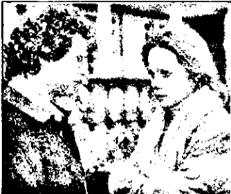
PRO 7 : 21,15 Doar crimă, nu - serial german

9,40 Lumea jocurilor - cu Ulrich Mayer 10,10 Des. anim. 11,00 Video-joc 11,30 Emisiune pt. copii în direct 12,00 Magazin politic 13,00 Baschet NBA