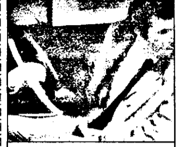
21,15 Colombo - s. polițist american

am. 14,30 Vaporul iubirii - s. am. 15,30 Bonanza - s. am. 16,25 Alf - s. am. 17,00 Star Trek - s. sf. am. 18,00 :5x5 - concurs TV 19,00 Total ori nimic - concurs TV