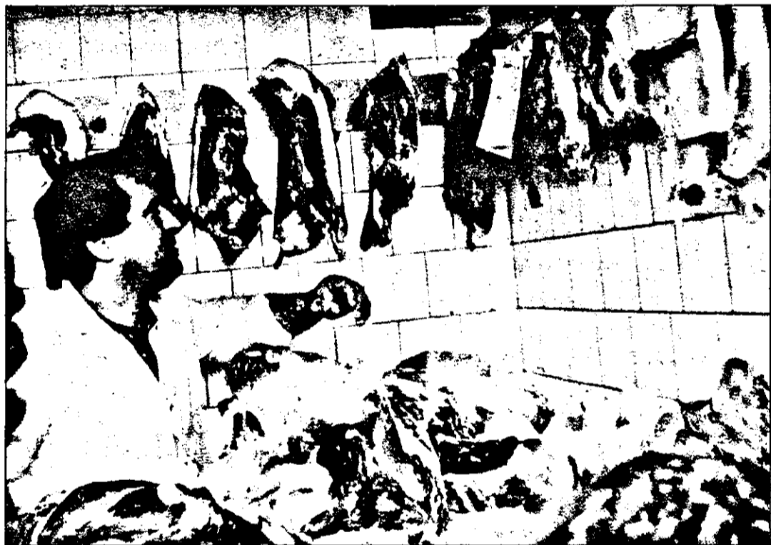
Înainte, visam să avem ce cumpăra. Acum, să avem cu ce...