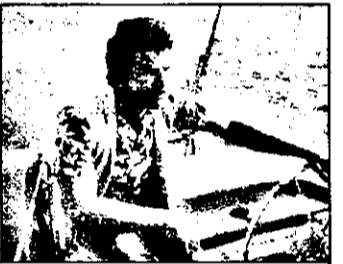
BUDAPESTA 1 : 18.35 Magnum - serial polițist SUA

8,00 Tele-shop 8,30 Prezentarea programului 8,32 Aștept oaspeți 9,02 Școala lui 9,35 Abecedarul calculatoare