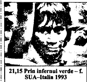
21,15 Prin infernul verde - f. SUA-Italia 1993

BUDAPESTA-2 15,50 Teletext, prezentarea progr.