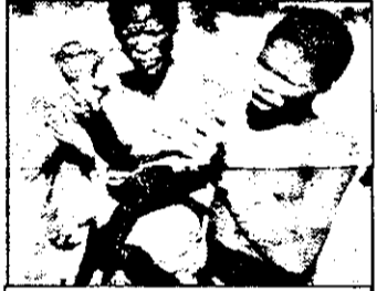
21.15 Zeii au căzut în cap - comedie Africa de Sud, 1982

7.00 Prezentarea programului 7.03 Viața satului 7.25 Jurnal regional 7.35 Stiri economice 8.00-10.00 Răsărit - magazin matinal 10.00-13.30 Magazin: 10.30 Riviera - serial 11.30 Dallas - serial am.: Nuntă 12.30 Telegoc 13.00 Stiri 13.30 Telegoc 13.00 Stiri 13.07 Magazin economic 13.32 Destine - magazinul întreprinzătorilor - reluare 14.12 Curs de limba germană - reluare 14.42 Teletext 14.52 Mariile familii - serial Franța, IV/3 16.16 Calendar. Ziua Pământului 16.35 Prezentarea programului 16.40 Viața satului - reluare 17.00 Stiri, meteo 17.11 Tele-lectia - emisiune pentru elevi: Apreciere 17.31 Computer familial 18.00 Emisiunea vârstnicilor 18.30 Informații utile 19.40 Fecăstră - magazin informativ 19.55 Familia Mezga - desene animate 20.20 Emisiune electorală 20.30 Telegoc 21.15 Dallas - serial am.: Nunta 22.10 Panorams - magazin politic