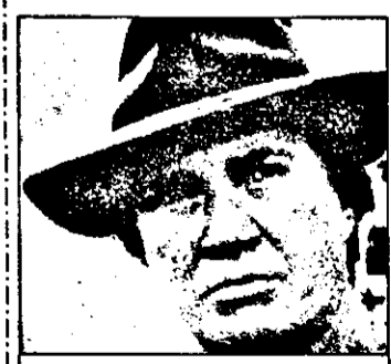
23,05 Kung Fu - s. acțiune SUA

9,00 Știri ITN 9,15 Bursa SUA 9,30 Jurnal NBC 10,00 Super shop 13,00 Mag. econom. mondial 13,30 Mag. politic est-european 14,00 Astăzi - mag. informativ 14,30 Mag. econom. est-european 15,00 Azi - mag. informativ 15,30 Roata banilor - Informații de pe Wall Street 18,30 Burse europene 19,00 Azi - mag. informațional 20,00 Știri ITN 20,30 Mag. muzical