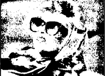
PRO 7 : 21,15 A doua zi, dimineața - film polițist SUA, 1986

7,05 Hotel - serial american 7,50 Desene animate 9,05 Parker Lewis, Un grec la Chicago, Dynasty - seriale SUA 11,00 Elvețianul Notti - reluare 12,45 Bill Cosby show - reluare 13,15 Sperietoarea și Mrs King - serial polițist american 14,10 Hotelul - serial polițist SUA, 1983: Perspectiva 15,05 Dynasty - serial american: Fiul născut se întoarce 16,00 Lindenau - talkshow