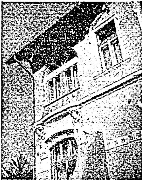
Detaliu arhitectonic al vilei „Rozmarin” din stațiunea Moneasa.

Recent, „British Museum” a anunțat că l-a fost donat un lanț de aur purtat de regina Maria-Antoaneta înainte de a fi ghilotinată. În 1793. Bijuteria — și-ar fi fost luată reginei în momentul când a fost urcată în șarjeta ghilotinaților.