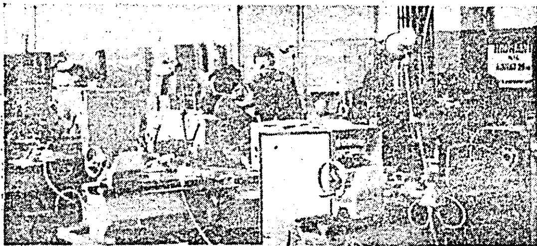
I.M.U.A. Se pregătește un nou lot de strunguri destinat beneficiarilor externi.