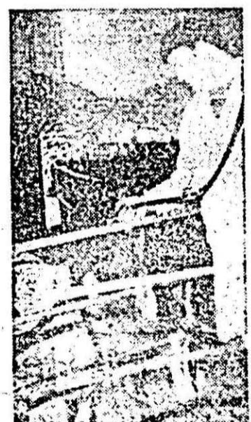
La ferma zootehnică a CAP Zădăreni, verificarea stării de sănătate a animalelor este o preocupare de zi cu zi.