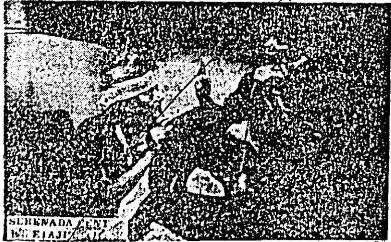
În clipșe: secvență din film.