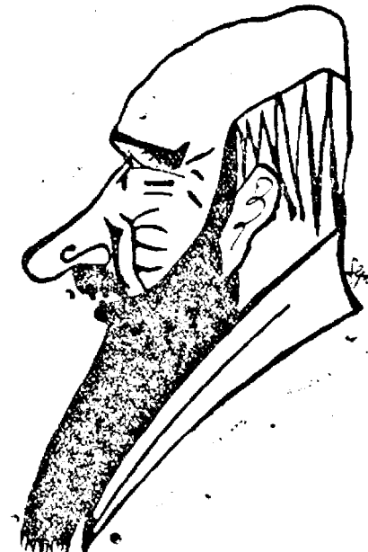
Buzagiu, dușmanul țărănimii române și vândul străinilor